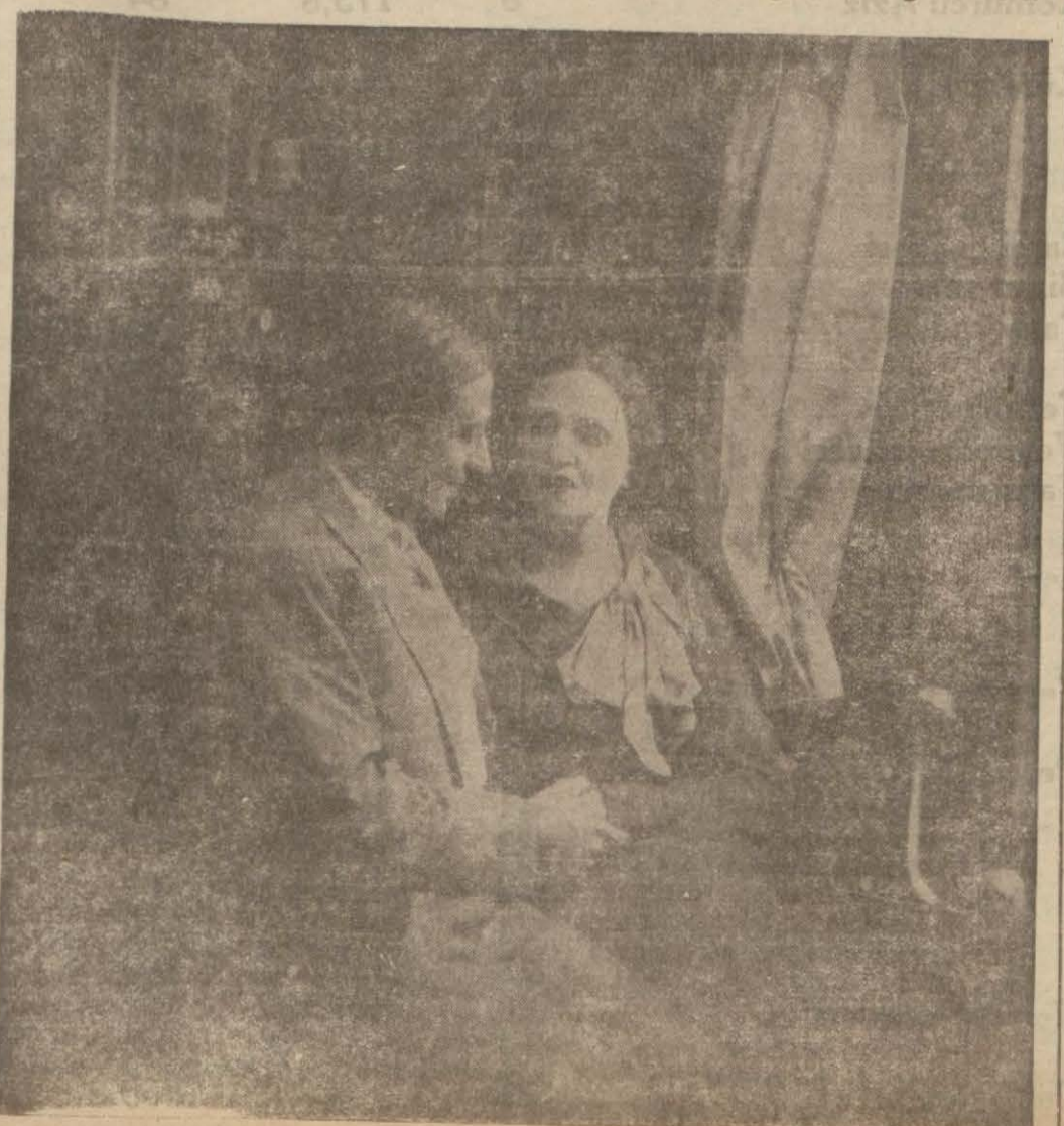
"Fena yol", filminden bir sahne

Bir gün Kristina köyün kilisesinde dua ederken yakışıklı bir adam refakatinde bir kadın görüyor. Bu, Krisoula'dır. Niono'dan ayrılmıştır. Şimdi bir genç bankerle yaşamaktadır. İki eski arkadaş barışıyorlar. Hayat