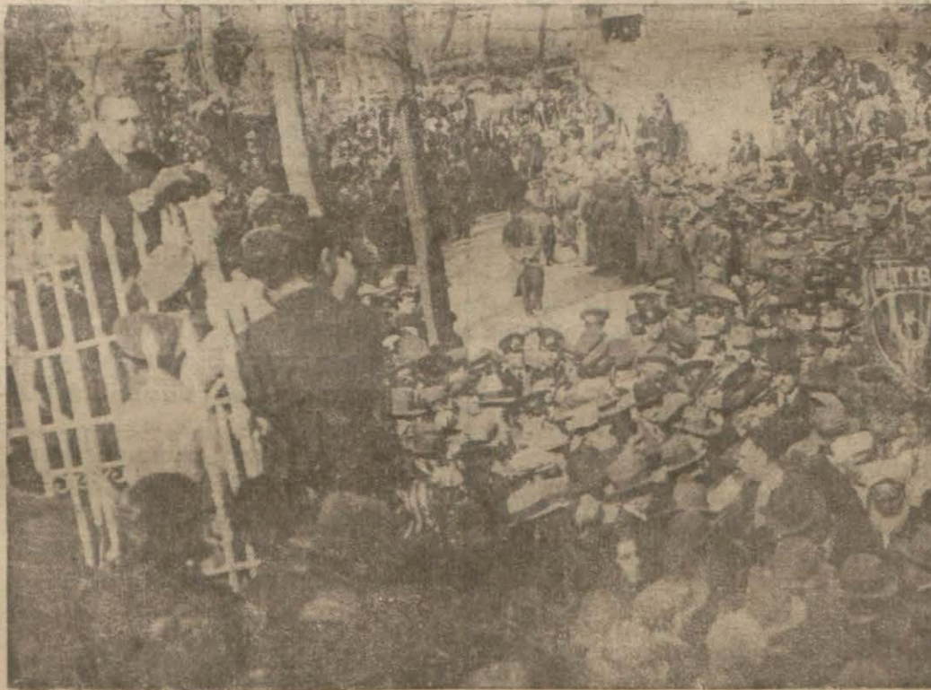
Etem İzzet Bey şehir namına nutkunu söylüyor.