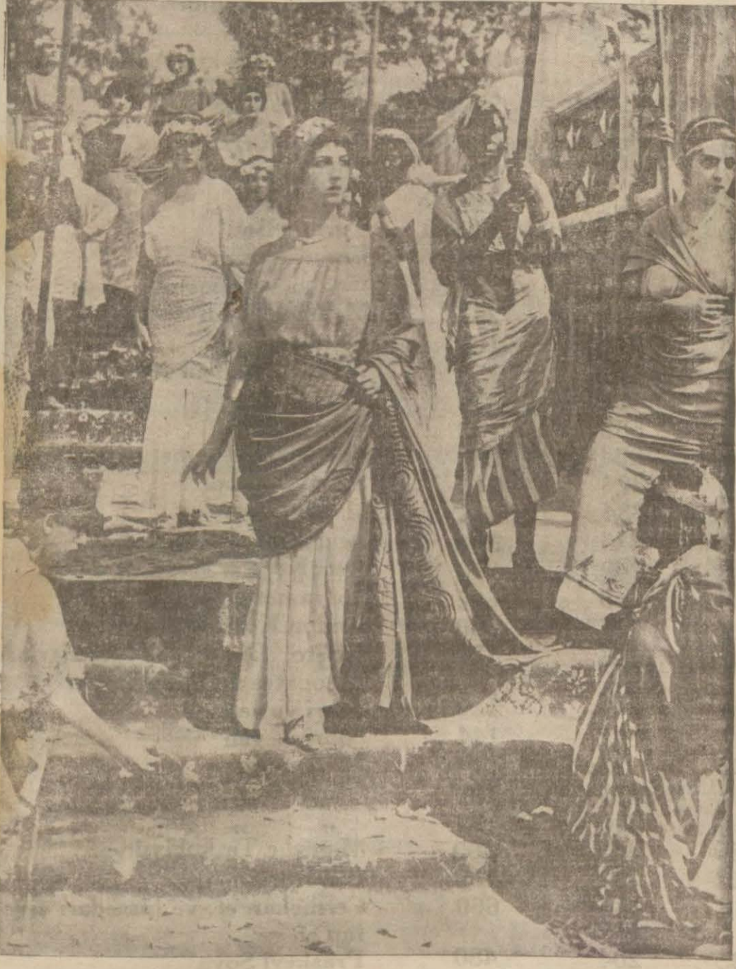
"Neron", Filminden bir sahne