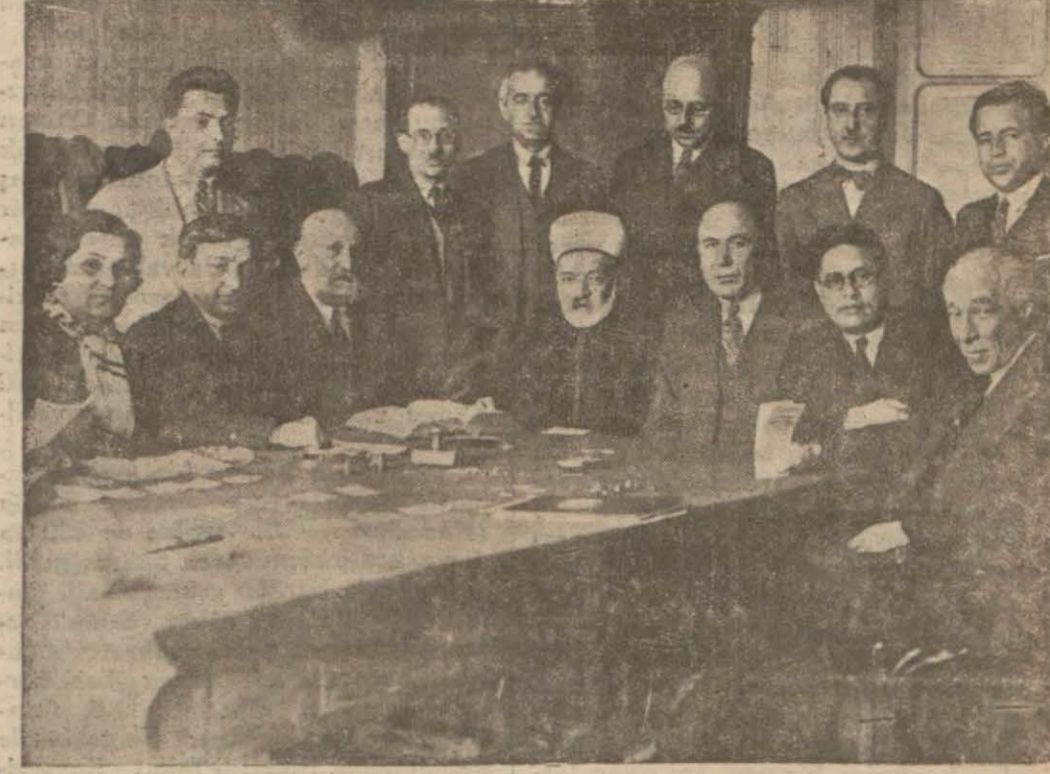
Dün Dil Derleme Heyetinin yaptığı toplantıda

BERLIN, 13. (Saat 24 radyo) — 1919 senesinde Sağ cenah fırkası mensuplarından Eisener'e suikast teşebbüsünde bulunmuş olan komünistlerden Arko Walke bu defa Hitleri öldürmeğe teşebbüs etmiş ise de zabıta uyanık davranmış ve teşebbüsünü icraya imkân bılmadan tevkiye muvaffak olmuştur.