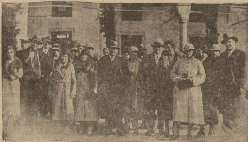
Seyyah akını başladı. Bu resim dün şehrimizi gezen seyyahlardan bir grupu gösteriyor

mek, Türk dilini bu asrın konuşur, yazar, anlatır tam ve kusursuz dili derecesine çıkarmak, yalnız milli