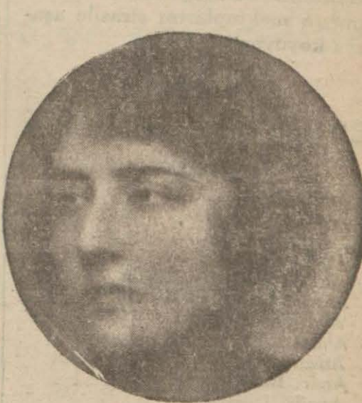
16-3-33 t. Perşembe akşamı saat 21,30 da Viyana radyosunda şarkılar söyleyecektir.