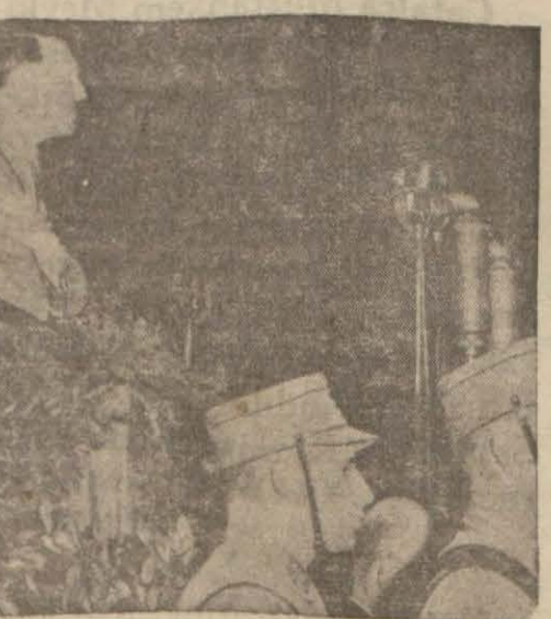
Hitler'in dört mikrofona karıştırdığı 24 şubatta verdiği konferans esnasında çekilmiş bir resim

Bugünlerde 500 kilovatluk takatindeki Moskova istasyonu neşriyatı başlayacaktır. Merkez için birçok tecrübelerden sonra 900 ile 1000 metre arasında bir dalga münasip görülmüştür. Bu dalgalara ara sıra karıştırıp dünyanın en kuvvetli istasyonunu arıyoruz.