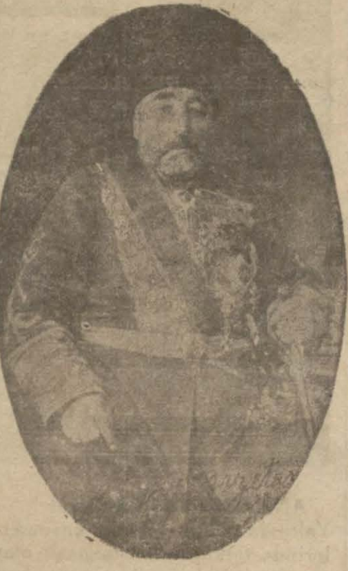
Kayserili Ahmet Paşa

"1291 de Şurayi Devlet azalığına tayin edilmiş, sonra üçüncü defa İzmir, Hüdavendigâr, dördüncü defa İzmir ve Adana Valiliklerinde bulunarak 1293 te Bahriye Nazırı olmuş-