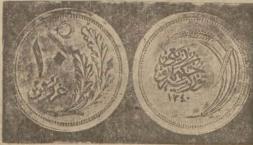
Gümüş para çıkarıldıktan sonra piyasadan kaldırılacak bronz on kuruşluk

ANKARA, 12 (Telefonla) — Meclis encümenlerinde yeni mâde ni ufaklık para basılması hakkındaki kanun lâyihasının tetkikine gelecek hafta başlanacaktır. Dün başlıca esaslarını bildirdiğim bu lâyihanın diğer hükümlerine göre gümüş para için kabul haddi 20 lira, on ve beş kuruşluk nikel para için 5 lira, bir kuruşluk nikel para için bir lira ve bronz için de 25 kuruş olacaktır. Mal sandıklarına ve Cümhuriyet Merkez bankası merkez ve şubelerine tediye makamında veya mübadele maksadile ibraz edilecek gümüş, nikel ve bronz paraların miktarı ne olursa