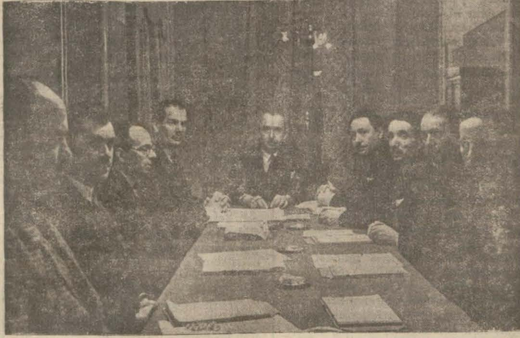
Türk dili tetkik cemiyetinin son içtimalarından alınmış resimlerden

Dilimizi türkçeleştirmek savaşın da yeni bir merhaleye geldik: Türk Dili Tetkik Cemiyeti evvelki gün Büyük Gazinin Reisliği altında yaptığı bir içtimada ehemmiyetli kararlar verdi. Cemiyet Umumi Kâtipliği tarafından neşredilen bir tebliğ ile osmanlıca dilin türkçeye geçişi yapılacak yeni bir hamle için bütün millet vazifeye davet ediliyor. Türk Dili Tetkik Cemiyetinin bu tebliği ayrıca Firka Umumi Kâtipliği Recep Bey tarafından Firka idare heyeti ve Halkevi reisliklerine ve Maarif Vekili Reşit Galip Bey tarafından da gazelere bildirilmiştir.