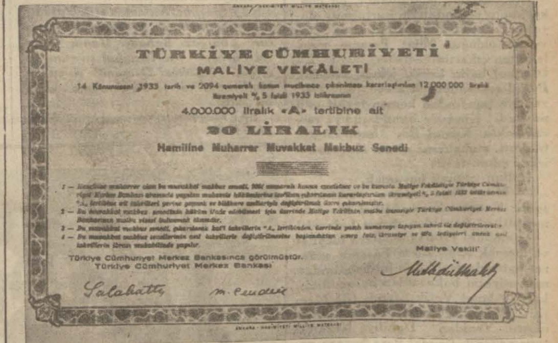
Tab'ı bitirilen tahvillerden biri.

ANKARA, 10 (Telefonla) — Şefakatlı - Ergani demiryolunun inşa masrafına karşılık olmak üzere hazinace senevi yüzde yedi faiz ve ikramiyeli olmak üzere hükmete verilen on iki milyon Türk liralık dahilî istikraz salâhiyeti üzerine Maliye vekâlet İcümhuriyet Merkez Bankası arasında mukavele akıt ve imza edilmiş olduğundan Maliye vekâleti, halka tevzi edilmek üzere bir izah broşürü tabettirmek üzere. Elyevm tertibini teşkil eden dört milyon liralık kısmını muvakkat senetlerinin de tab'ı ikmal edilmiştir. Bunlar yirmişer bin