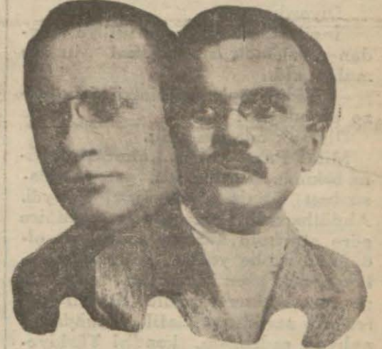
M. Molotoff (sağda) ve M. Litvinoff

Büyük komşumuz ve dostumuz Sovyet Rusyanın kıymetli hariciye komiseri M. Litvinof, ben Cenevrede ayrılrırken veda ziyaretindeki görüşmelerimizde, Cümhuriyetimizin onuncu bayramını