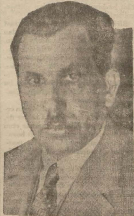
Kâzım Paşa Hz.

bunu dahilî bir istikraz ile temin etmenin yolu vardır. Muhakkak ki hem çok teminatlı hem de çok kârlı olan bu iş; halkın derin alâkasını celbedecektir. Şunu da unutmamak lâzım ki devlet ve milletçe bu teşebbüsü tahakkuk ettirmekte yalnız