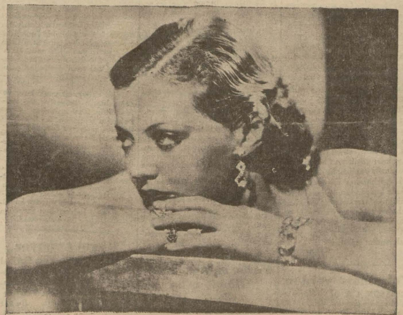
Birdenbire yükselen ve Amerikalıların kalplerinde büyük bir yer tutan Silvia Sidney

James Stuart nefret ettiği kıızı ile Amerika'ya gitti. Ritanın hatırladığı ilk vak'ardan biri uydurma bir ring üzerinde kendinden büyük bir oğlanla boks ettiği, daha doğrusu oğ-lanın yumruklarından küçük vücudu ru esirgeneye çalıştığıdır. O zaman Rita yedi yaşında idi ve babası zavallı kıza böyle boks maçları yaptı-