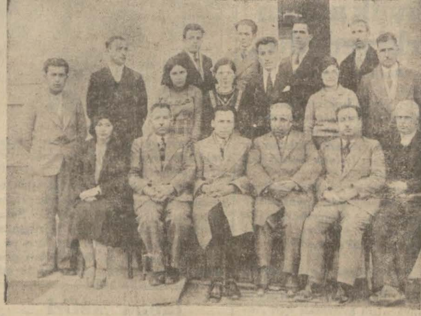
Kasabada fakir talebeleri himaye heyeti