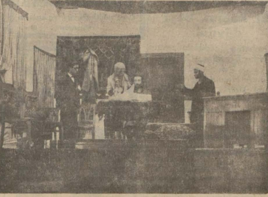
"Cehennem", plgesinden bir sahne

Mustafa Kemal gençliğinin mü tekâmil ve mütebariz zaferlerini gözlerimizle gördükçe duyduğum-uz ıftihar, hissettığımız gürur ve saadet tarif edilemeyecek ka-dar sınırsızdır. Ordu gençleri bir gece evvel Ordu su yolu menfeati-ne (Cehennem) i oynadılar. Cehen-nem, bu muazzam ve muhteşem eser, okadar büyük bir muvaffa-kiyetle oynandı ve başarıldı ki... Duyan, duyduran; ağıyan, ağla-tan gençler oyun imtidadına hal-kin içine sigıramadığı alkışlarını topladılar.