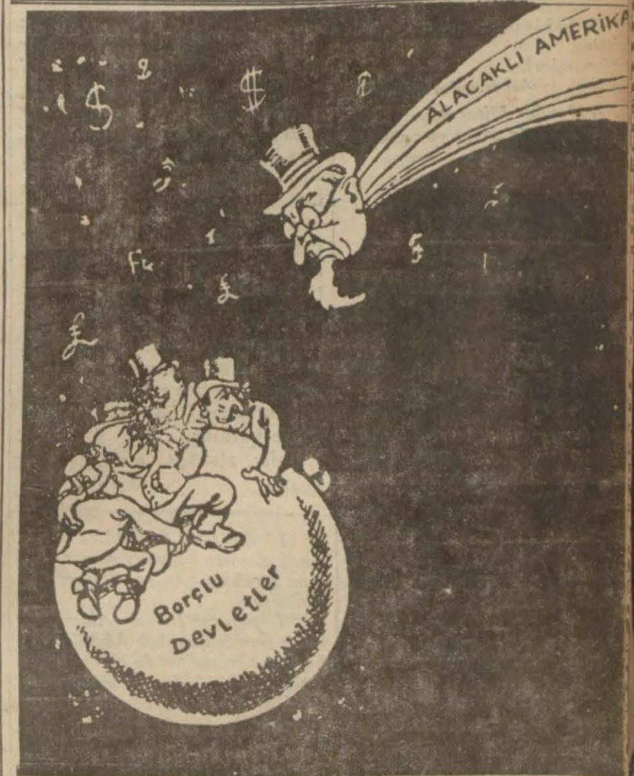
— Avrupa karikatürü — Mutlaka çarpışacaklar