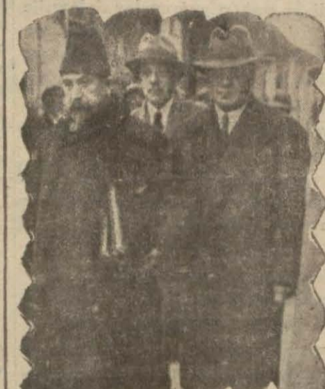
Mösyö Suriç Galata Rıhtımında

Rusyadan getirilip kurulacak fabrikalar ne oldu?