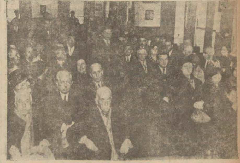
Gayrimübadiller kongresinde hazır bulunanlardan.

Yunanistanla Yugoslavya arasında bir gümrük ittihadı yapılabilmesi için mevcut tasavvurlar hayli ilerlemiştir. Şimdilik proje halinde bulunan bu mevzu üzerinde işlenmektedir. Yunanistan Balkan memleketleri içinde en fazla Türkiye ve Yugoslavyadan mal almaktadır. Yunanistan bunun için böyle bir gümrük ittihadını her iki memleket için muameleyi arttıracak mahiyette telâkki etmektedir.