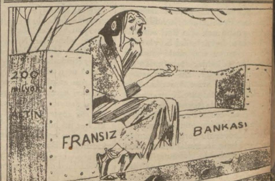
— Avrupa karikatürü —

Faaliyet komitelerini takip edecek altı kişilik komisyon ilk itimamı yarın yapacak ve bazı kararlar verecektir. Maarif Vekâleti söz derleme işini teşhil için bazı tamimler göndermiştir. Bu tamimlerde faaliyet esasları şekli izlenmektedir.