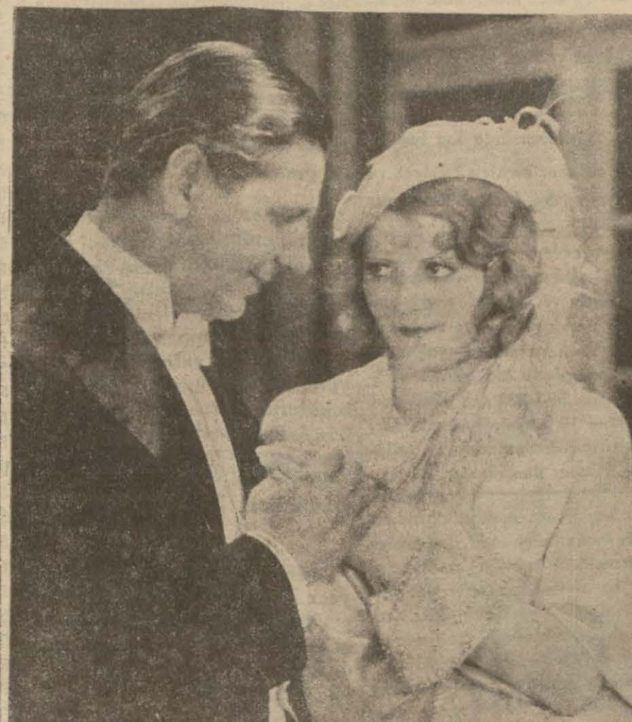
"Sahte milyoner" filminden bir sahne

cecek ve büyük anne sabırsızlıkla yeni evliliği bekliyor. Büyük anne Andreyle Le Baroyer yerine alıyor ve yeni evliliği bir odaya kapıyor. Yanıldığını anlayınca büyük anne çok kızıyor