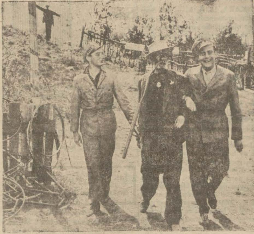
"Sarışın Rüya" filminden bir sahne

Balayı seyyahatı Helen'in büyük annesinin malikânesinde geç-