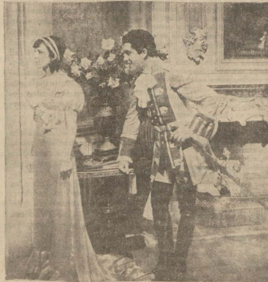
"Kara kartal" filminden bir sahne