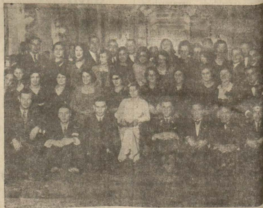
Erenköy İsmailiyye Cemiyeti dün akşam Tokathyanda azaya mahsus bir danslı çay vermiştir.