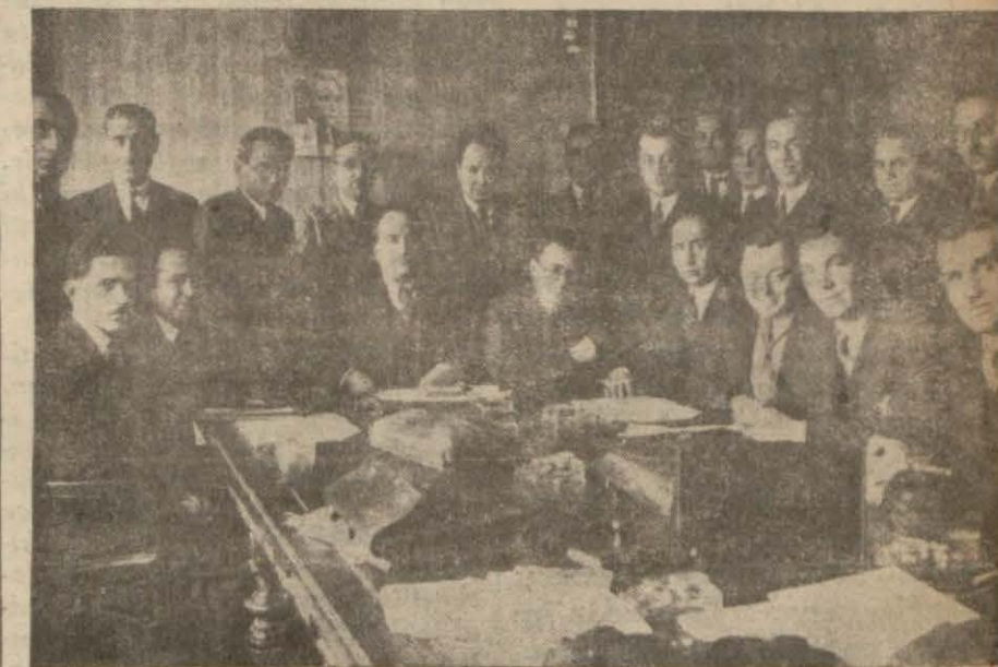
Dün maarif müfettişlerinin yaptığı içtimada..