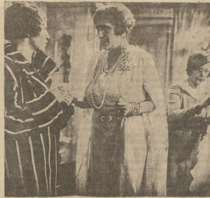
"Bir çiçek İki böcek" filminden bir sahne