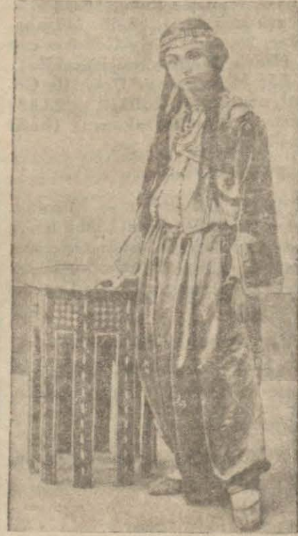
Dürrüşehvarın bir resmi

NICE (Hususi) — Sakıt halife Abdülmeccit, Dürrüşehvarla Nilüferi bir çekmece Hint elmasına nasıl değişti? Düğün tafsilatına girmeden evvel bundan bahsetmek isterim. Abdülmeccit, Nice'e yerleştikten sonra bir müddet eski yaşayış tarzını değiştirmemiştir. Safdillere mahsus âmirane gururu, eski saray âdetlerini birden bire terketmeğe namiddi. Her akşam etrafına oplanan dalkavuklara villasından ziyafetler veriyor, eski debdeli günleri aratmayacak şekilde eğlenceler tertip ediyor, hazıra dağların bile dayanım yacağını bilmez gibi görünüyordu. Beraberinde götürdüğü mücevherler, ucuz pahalı elden çıkıp ta satılacak savulacak bir şey kalmayınca Abdülmeccidin ayakları suya erdi.