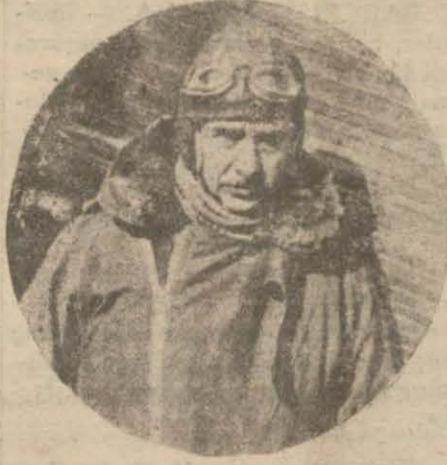
Başvekil Hz. tayyare kıyafetile..