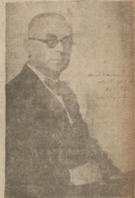
Büyük muvafakiyeti her tarafa takdirle karşılanan İktisat Vekili Celâl Bey

Ankaranın ikinci teşrin zarfında tedvinine başladığı (Yeni İktisat Siyaseti) ferdi teşebbüsün tevçize doğru gittikçe daha büyük bir sür'atle inkişaf etmektedir. Devletin rolleri kendi üzerine almaz yüzünden ferdi sermaye hemen yok denecek bir vaziyete düşmüştü. Fakat, son 3 ay zarfında devlet iktisat dairesiyle sermayedarlar arasında bir teşvik meseleyi doğru bazı teşebbüslerin başladığını görmüştür. Herseyi kendi eline almak niyetinde olduğunu göstermek için hükümetin en kat'i hareketlerinden biri vapur işletmelerini devletleştirmeğe dair olan Meclis kararını geri almadığı olmuştur ki, mezkûr karara göre bütün vapur donatılarının vapurlarını devlete satmalarını lâzımgeliyordu. Şimdi vapur sahipleri devlet müessesesi olan Seyrisefainin yanında bazı hatlar üzerinde müstakillen vapur işletmeye mezundurular. Şukadar var ki navlun, nakliye ücreti konfor v.s.