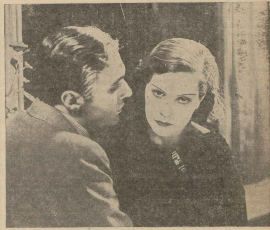
(Atmaca) filminde Nathalie Paley, Charles Boyer