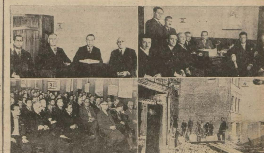
GÜNÜN RESİMLERİNDEN: (1) Sıhhat müdürlüğünde toplanan fuhuş yerlerini tespit komisyonu; (2) — Kaymakamların Belediyeye yaptığı içtimada; (3) Yeşilhilâçilerin kongresi; (4) — Balatta yikulan ev — Yazıları iç sahifelerde —

ANKARA, 28 (Telefonla) — İcra vekilleri heyeti önümüzdeki hafta iktisadi programın müzakeresine devam edecek ve program bu suretle katiyet kesbetmiş bulunacaktır. Program tatbikatının icap ettireceği kanun lâyiha İktisat vekâleti tarafından hazırlanmağa başlanacak ve mart içtimamında bu lâyiha Meclise sevkolunacaktır.