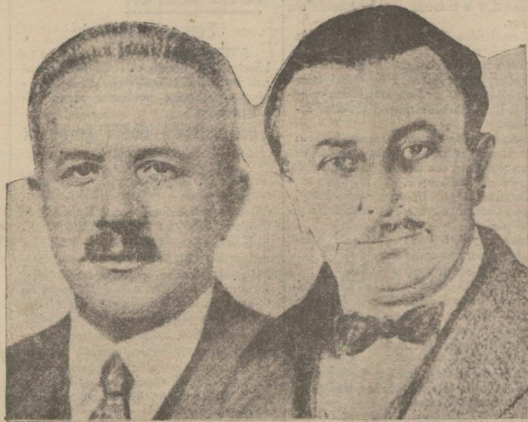
Adliye vekili Zekâi B.