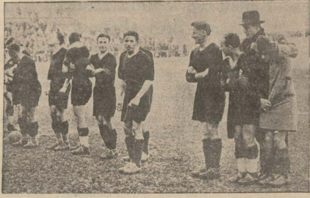
İşte Fransada iki şehir takımı arasındaki maçtan evvel nutukların uzamasından titreyen futbolcular

landıkları oyun tarzını anlatmak için bunlardan bazılarının (Tosun, aslan, hoca) gibi lakapları olduğunu anlatıyor.