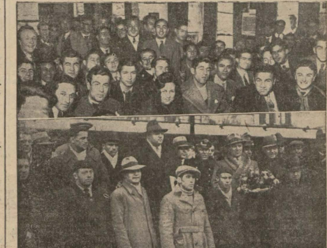
Dün şehrimize gelen Bulgar güreşçileri ve kongresini yapan Hukuk Talebe Cemiyeti — Yazısı iç sahifelerimizde —

— Utan da bu lafi itme!.. Üşüme ne dir? Senin yaşında delikanlı üşür mü ki? Bizim Tibliste olsan halin neye vakti? (Lütfen sayfayı çeviriniz)