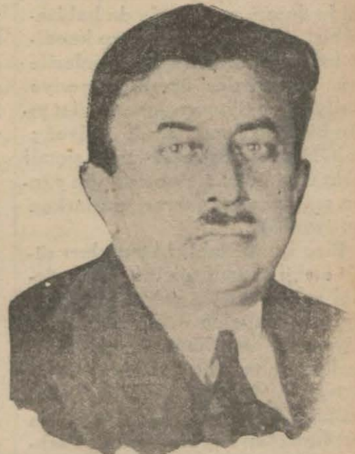
Sinema ve tiyatroların kapanma saatleri hakkında dün yeni emrini bildiren Dahiliye vekili Şükrü Kaya B.

Fakat, dün akşam geç vakit Dahiliye vekâletinden vilâyete gelen yeni bir emir hem bu vaziyeti alt üst etmiş, hem de gerek halkın ekseriyeti, gerek sinema sahipleri tarafından (Devamı 5 inci sahifede)