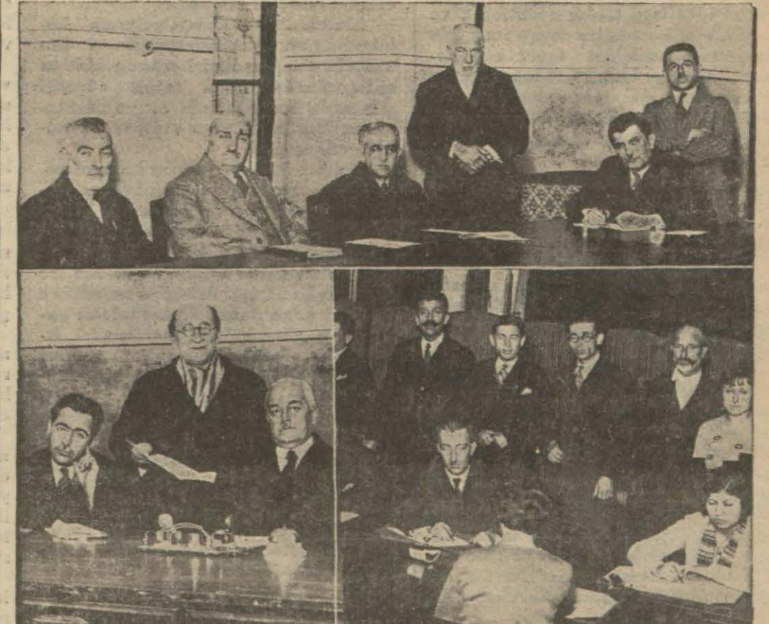
Birinci ceza mahkemesi Muallimler Birliği binasında, birinci ticaret mahkemesi Ticaret Odası salonunda, ikinci ceza mahkemesi Sultanahmette Taş mektepte çalışıyorlar.