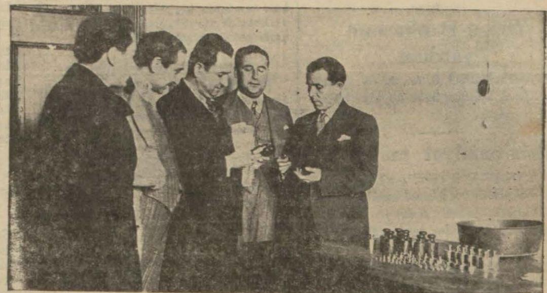
Ölçüler başmüfettişi izahat veriyor.

İcra dairesi için de şimdilik Topkane Müsirlüğünün tahsis takarrür etmiştir. (Devamı 6 mcr sahifede)