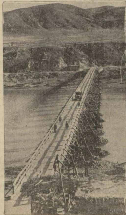
Elâzizle Pertek arasında Pertek köprüsü..

Pertekten geçen Elâziz ve Erzincan şose yolunun henüz Pertek hududunda yapılmış bulunan kısımları noksandır. Bunların tamamlanması için faaliyet devam etmektedir. Pertekten Hozana giden ve Elâzize Pertek arasındaki yolun çok yerleri pek bozuk bir vaziyettedir. Pertekle Maz