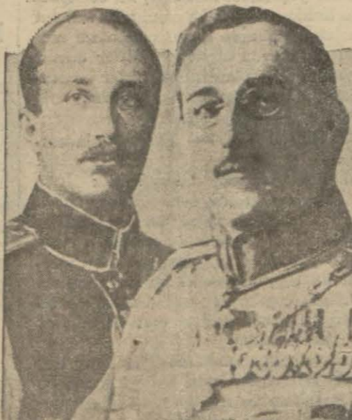
Bulgar ve Yugoslav kraları Boris ve Alexandre hazeratı

Projenin İcra Vekilleri heyetinde müzahere edileceği gün yarın kararlaştırılacaktır. Evvelce de bildirildiği gibi hazırlanan beş senelik program yalnız snaiye mahsus değildir ve çok şamil bir mahiyet arz etmektedir.