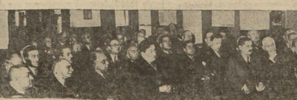
Baro heyeti umumiyesinin dün fevkalâde imat

1933 istikrazının hisse senetlerinin aynen para gibi her yerde tedavül etmesi, bilhassa devlet tarafından başa baş kabul edilmesi tahviller için bir sigorta telâkki edilmektedir. Her sene iki defa çekilen dolgun piyango, tahvillerin ayrıca satışını yükseltmektedir. Senede yüzde beş faiz bugün yatırılan bir para için emin bir daime gelir telâkki edilmektedir. Nihayet bu tahvillerin derhal alınması alaça yüzde beş kâr temin etmektedir. (B) tahvilleri 11 kânunusaniye kadar her bankada satılacaktır.