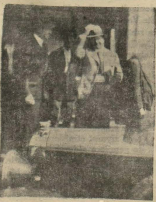
Her Röhm otomobile biniyor.

— Öteden beri çok sevdiğim dostumuz Türkiye'yi ziyaret etmek ve bilhassa burada yapılan terakkiyatı görmek istiyordum. Türkiye'nin hakikaten değiştiği anlaşılıyor. Ben asker olduğum için burada gördüğüm askerler beni çok alâkadar etti. Ötede beride rastgeldiğim zabıt ve askerlerin kıyaset ve vaziyetlerinden talim ve teşhiyelerinin mükemmel olduğu anlaşılıyor. Ümit ederim ki Türkiye ile