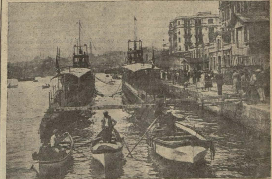
Dün limanımıza gelen İtalyan denizaltı gemileri..

Misak yeni bir sulhten bahsetmiyor. Fakat, Avrupa siyasi meselelerini tetkik için 4 devletin teşriki mesai ederek yeni hareket noktaları yaratmak hususunda iradelerini kullanacaklarını söylüyor, pek tabii diğer devletlere karşı hiç bir taarruz niyeti yoktur. Almanya artık gayri faal bir unsur değil, fakat Avrupa siyasetinde faal (Devamı 6 ıncı sahifede)