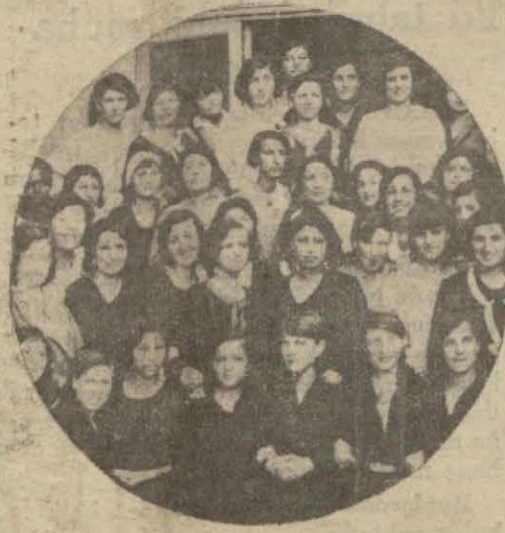
Kız muallim mektebinde

Kız muallim mektebi muallimler meclisinde bazı talebenin sınıf geçip geçmemesi yüzünden bir hâdis olmuştur. Mektebin son sınıfından geçen sene yirmi kadar talebe ipka kalmıştır. Bu talebe, bu sene sonunda da kanaat imtihanına girmişler, gene ipka kalmışlardır. Bu sene beşinci sınıftan kimse mezun olmayacağı için (Devamı 2 ıncı sahifede)