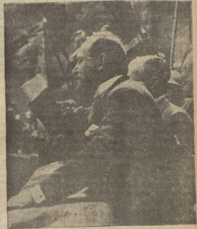
M. Mussolini nutuk söylüyor..

Berlin 8 A.A. — Dünkü şekilde Romada imzalanmış olan dörtler misakı, bu hususta söz söylemeğe mezun Alman mahafilinde, bütün ümitleri tatmin edici bir şekilde görülmekte, fakat bununla beraber alâkadar devletlere istikbalde sıkı teğriki mesai için