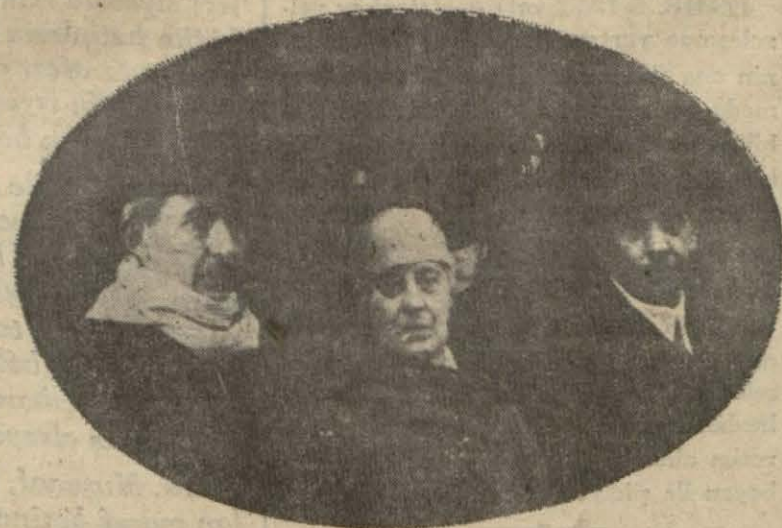
İyileştiği hakkında haberler gelen Madam Venizelos'ın İsmet ve Kâzım Paşalar arası da... teessürlerine tamamen iştirak ettiği esir olarak zat devletlerinden kendisiyle

Viyana. Sabık başvekile karşı yapılan suikast haberinden ve Madam Venizelosun aldığı yaradan son derece müteessir olarak zat devletlerinden kendisiyle