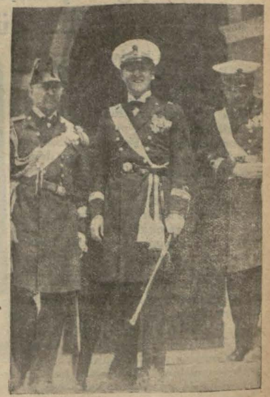
Kumandan vilâyetten çıkıyor nüne kadar limanımızda kalacaklardır.