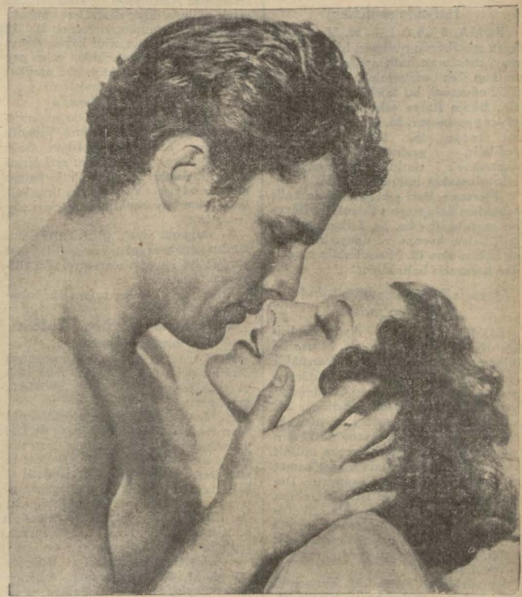
Kaska filminde Buster Grabbe (Arslan adam) rolünde France Dee yi öpüyor