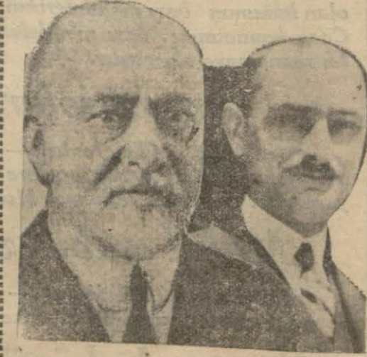
Adliye ve İktisat encümenleri reisleri

Faiz, tefecilik, halk bankası, borç Borç için gayrimenkul satışına ve muvazaaya dair yeni bir kanun