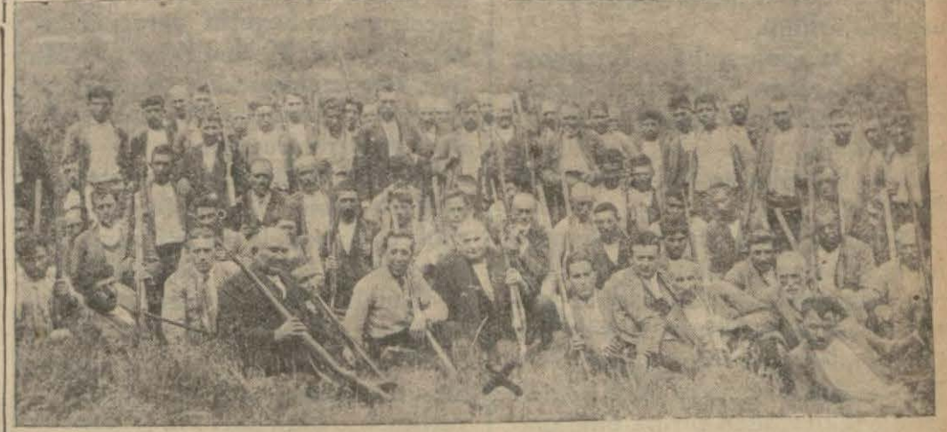
Milâsta her hafta s üreğe çıkan avcılar

Avcılar barıt ve saçma fiyatlarının indirilmesini istiyorlar