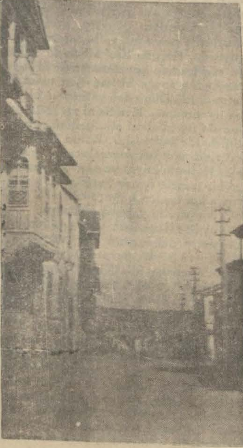
Elâziz'de Kışla caddesi

de başarılması şayanı temennidir. Burada yetişen pamuklardan ancak 20 numaraya kadar iplik çekilebilmektedir. Daha yüksek numaralarda iplik çıkarmak için çifçilerimize Amerikan mısır tohumları meccane dağıtmak ve onlara pamuk tasfini öğretmek lâzımdır. Bunların ipeklere gerek parlak ve gerek metanet itibarıyla Japon, Çin, İtalyan ipeklere tevlev edecek derecededir.