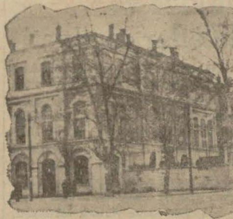
Istanbul lisesi binası

Edebiyat fakültesi profesörlerinden bir zatın söylediğine göre hattâ bu tevhit işinde fazla ileri bile gidilmiş, tedrisat noktasından bazı zararlarla karşılaşmıştır. Binaenaleyh Edebiyat fakültesinde yeniden tevhit edilecek kürsü tasavvur edilmemektedir. Önümüzdeki bir sene İslahat müddetinde Darülfünunda tatbik