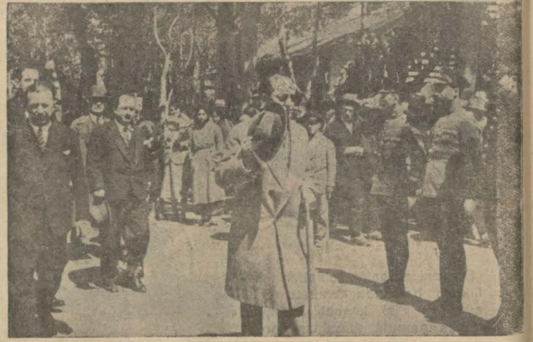
Hariciye Vekili Tevfik Rüşti Bey Ankarada

47 derecelik İstafilina RAKISI Litresi 235 Kr. Memleketin en nefis içkisidir. Çünkü fiçılarda dinlendirilmektedir. [3492] 3274