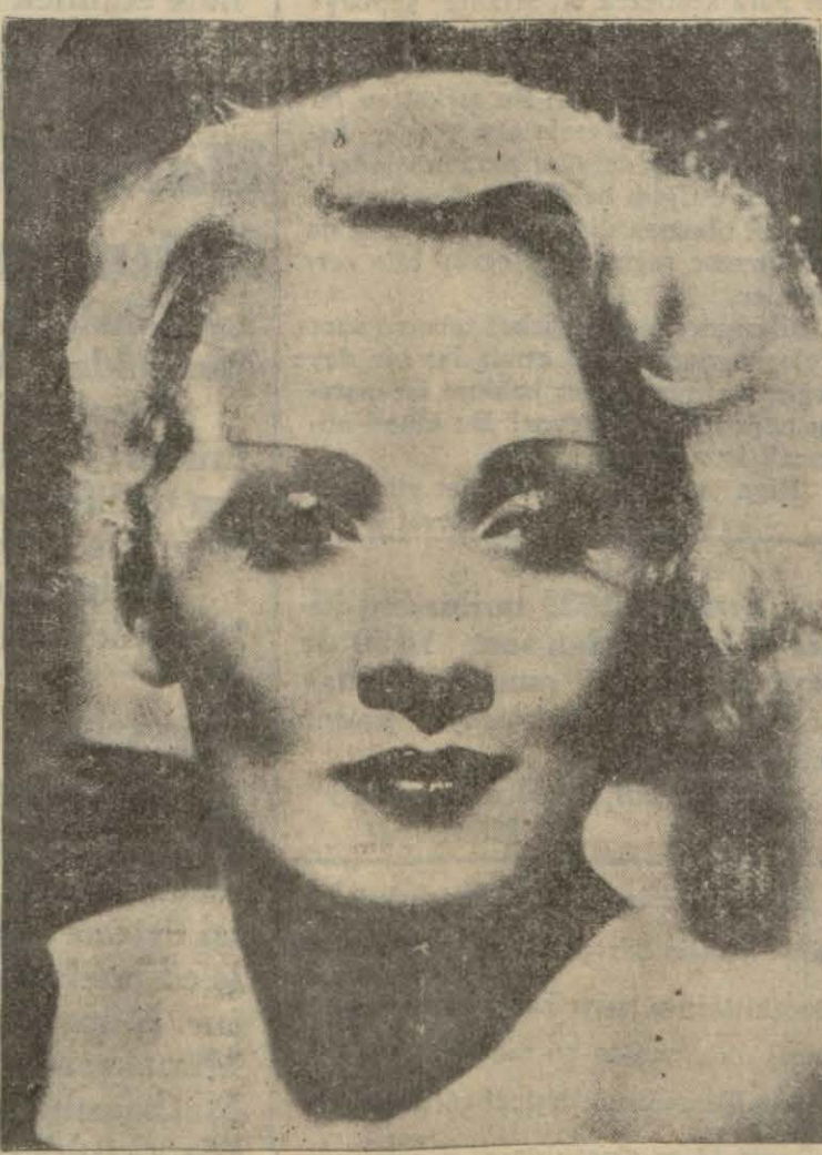
Mahmur Marlene Dietrich (Cassus) filmine böyleler.

Clark Gable, Ronald Colman, Gary Cooper, Wallace Berry bir hayli zahmet çekmişlerdir. Maamafih sine- ma kadın artistinden ziyade erkek ar-