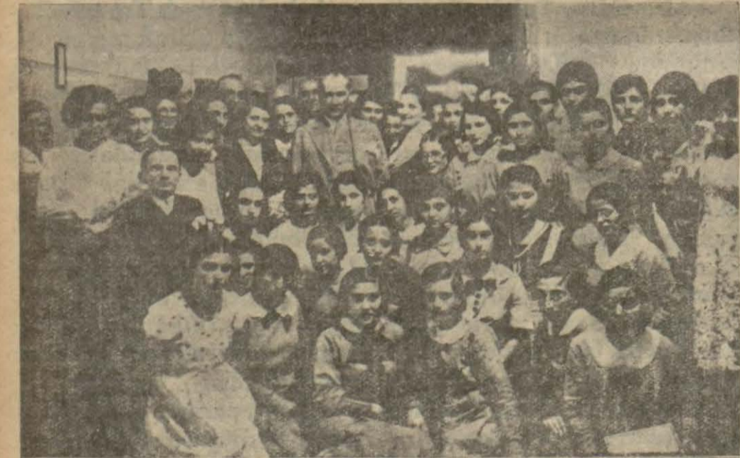
Gazi Hazretleri imtihanlarında bulunduğu İsmet Paşa Kız Enstitüsündekiler arasında

Vilâyetimizin tuttuğu bu çok faydalı yolun diğer vilâyetlerimize nümunne olması savanı temennidir.