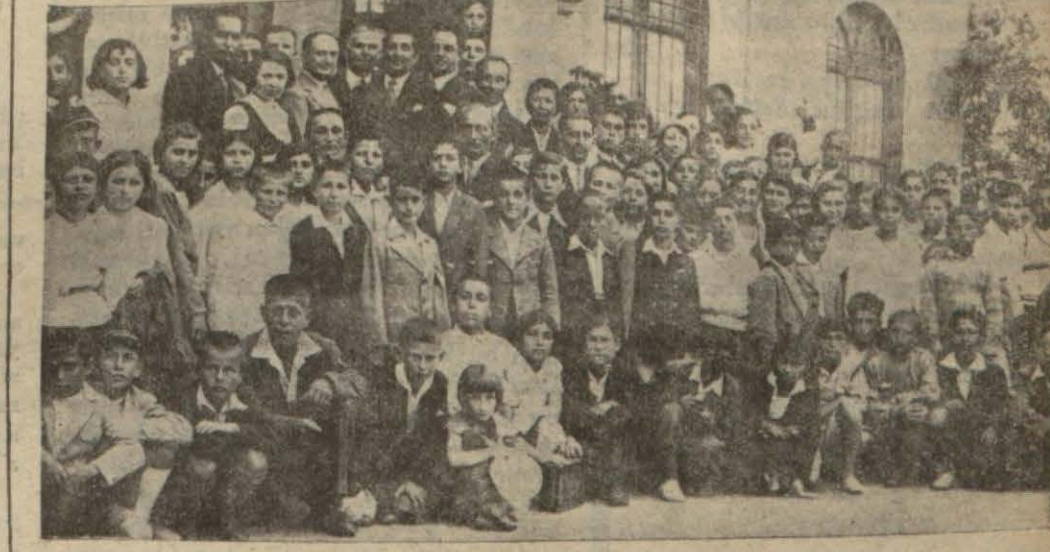
Sarıyer ilk mektepten mezun talebeye Halkevinde diploma tevzii — Yazısı Maarif haberleri sütununda —