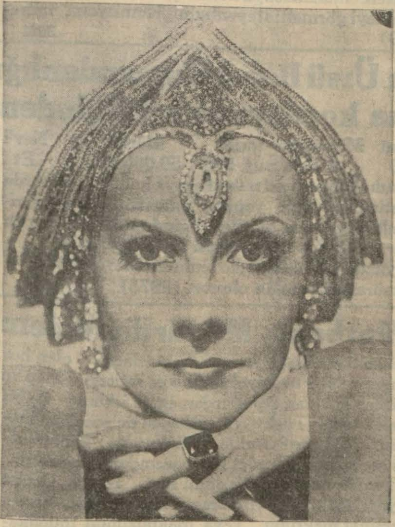
Esrengeiz Greta Garbo Mata Hari filmine böyle görünür

Bu iki kadın sinema âleminde gö- hangisinin ötekine üstün olduğunu