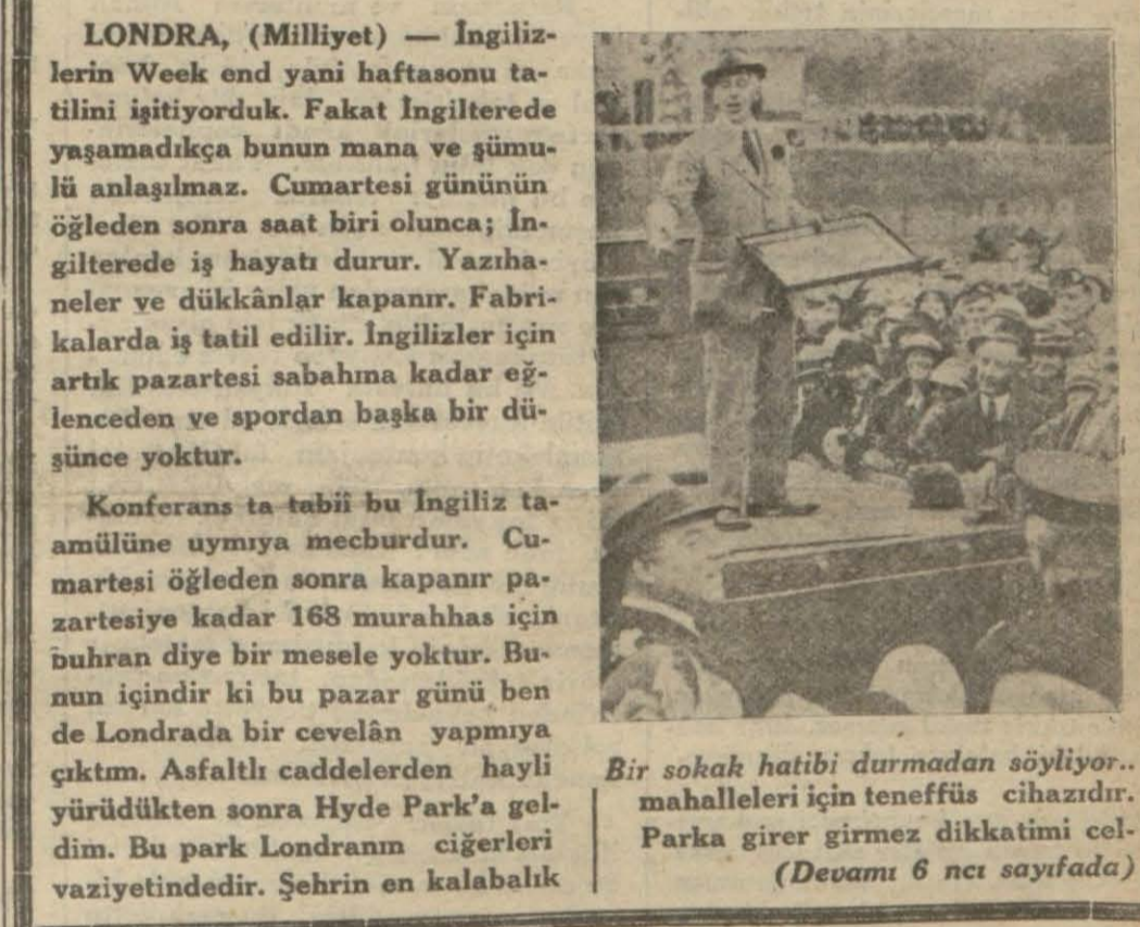
Bir sokak hatibi durmadan söylüyor.. mahalleleri için teneffüs cihazıdır. Parka girer girmez dikkatini cel-