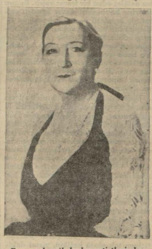
Franzisk komik kadın artistlerinde. Margerite Moreno