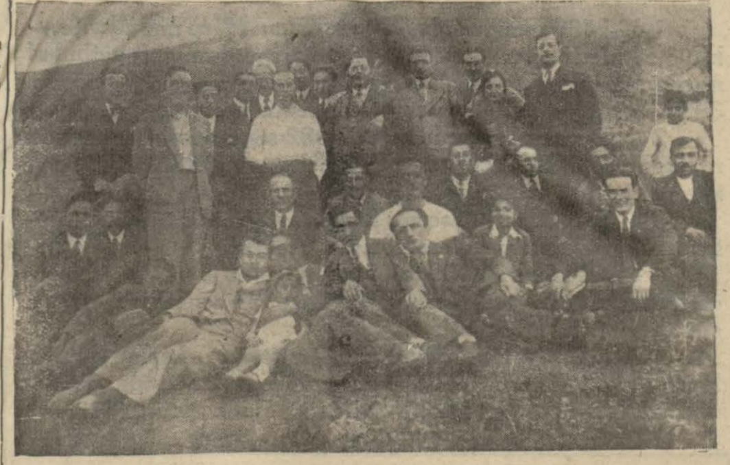
Ankara İcra dairesi mensupları

Ankara İcra dairesi mensubini geçen cuma hep bir arada "Kayaş", a giderek güzel bir kır eğlencesi yapmışlardır. Dere kenarında yemekler yenerek çaylar içilmiş ve muhtelif dans ve oyunlar oynanmış ve güzel bir gün geçirilmiştir.