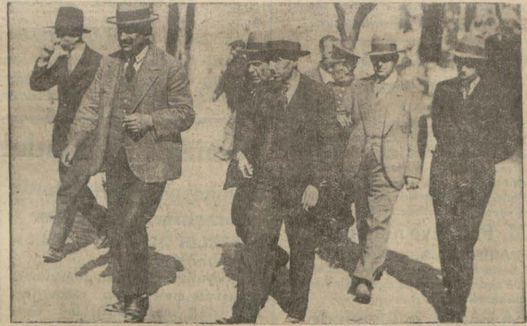
Eroinciler Emni yet Müdürlüğünde.