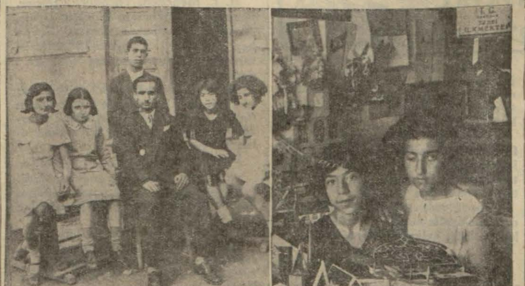
Sergiden i ki intiba

932 - 33 okuma yılının sonu münasebetile Kandilli 32 nci ilkmektepte Elisheri sergisi açılmıştır.