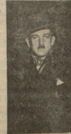
N. ESAT B.

Sumer-Bank'ın sanayi erbabına kredi yardımının da müfit olması için bazı mühim teşahvurlar vardır. Bu cümleden olacak, sanayi erbabının aralarında bir kooperatif vücut getirmeleri ve bankanın bu kooperatifle münasebet tesisile sanayi erbabına bu teşekkül vasıtasıyla yardım etmesi hem banka için daha emin, hem de sanayiciler için daha hayırlı olacaktır kanaati beslenmektedir.