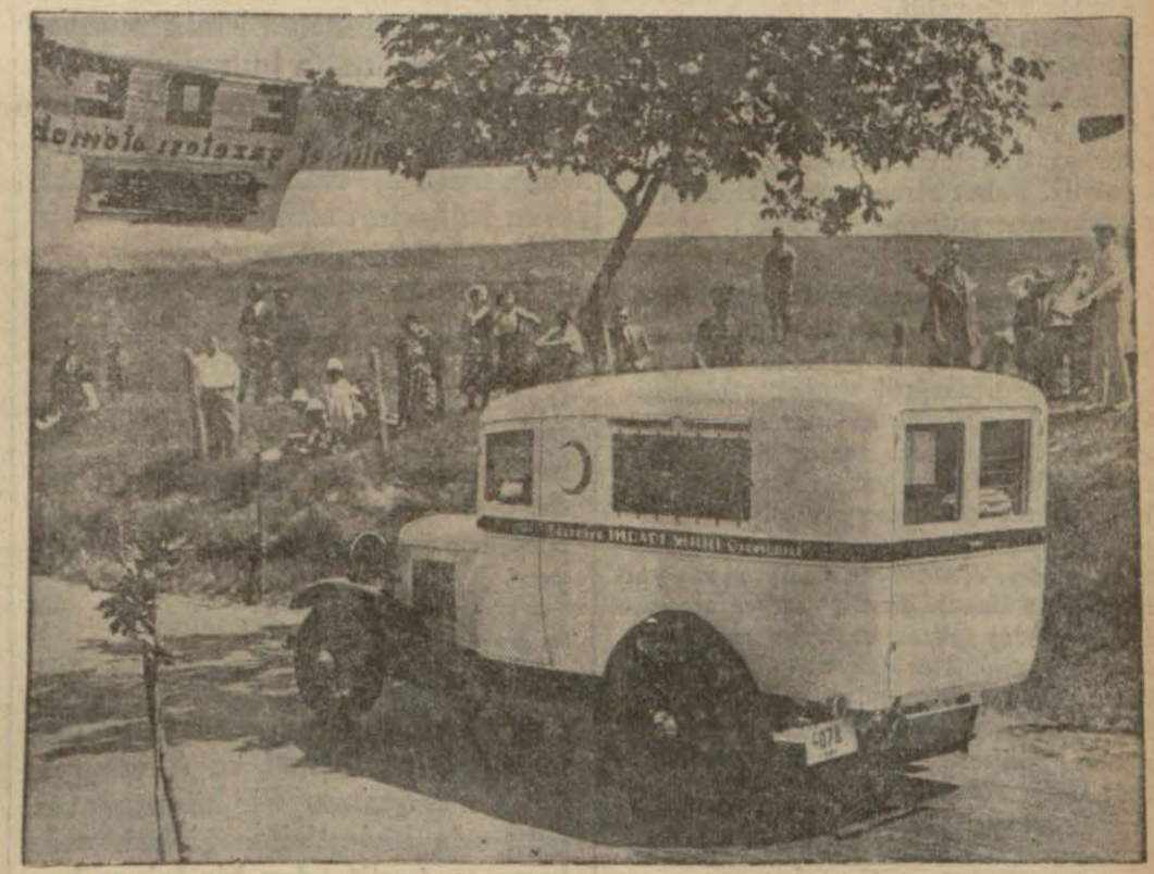
'da Samiye Burhan Cahit H. müsabakadan sonra kendisine verilen buketle, ortada sepetli motosiklet müsabakasında finali geçtikten sonra, sağda dünkü ufak arızaya çok seri bir surette yetişen İstanbul Belediye yesinin imadadı sıhhi otomobili