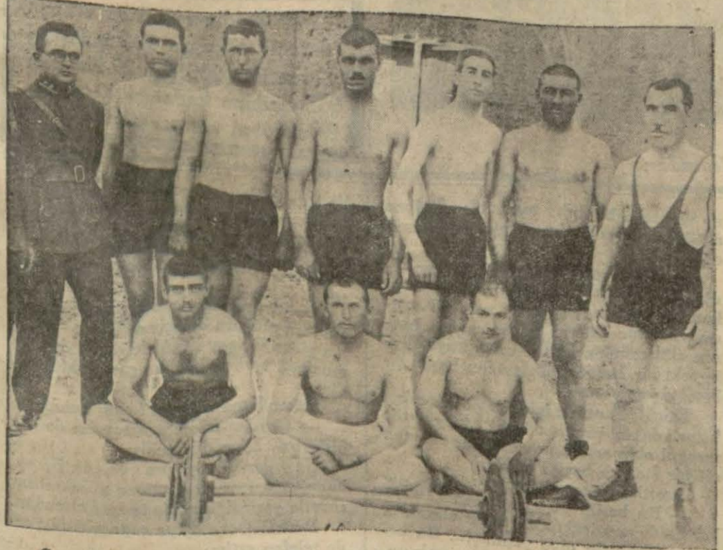
Son baharda Konya, Ankara, Eskişehir, Bursa ve İstanbul'a karşı bir güreş turnesi yapmak üzere şimdiden seçilerek faaliyete başlamış olan Malatya güreş takımı