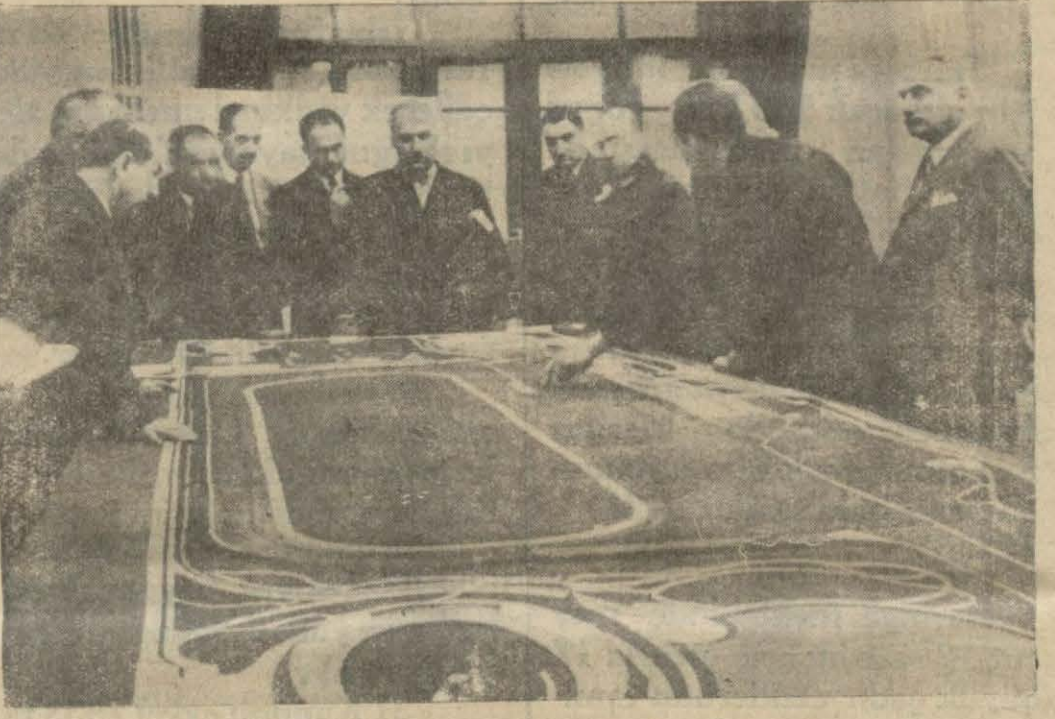
Ankarada yapılacak stadyumu n projelerini tetkik eden heyet

reklâmlar ve kitap kapları, mukavva işleri linolyom kesmelerle yapılmış resimler vardır. Resimlerimiz sergiden muhtelif manzaraları tesbit etmektedir.