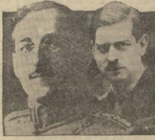
Konferansın son toplantısına iştirak eden Yugoslavya ve Romanya kralları

Maahaza emin mebandan aldığım mevsuk malûmata göre müzakerele- rin en şayanı dikkat neticesi şu olmuş- tur ki, üç devleti alâkadâr eden muhtelif meselelerin görüşülmesi neticesinde Türkiye Başvekilî tarafından ortaya atılan Balkan devletleri arasında