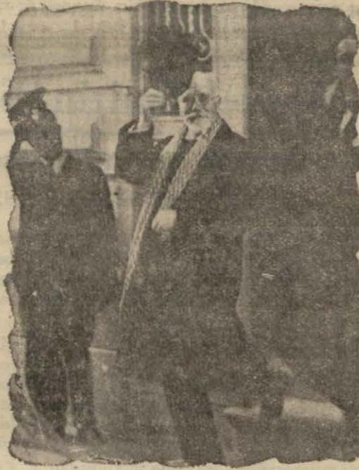
M. Venizelos, Perapalastan çıkıyor..