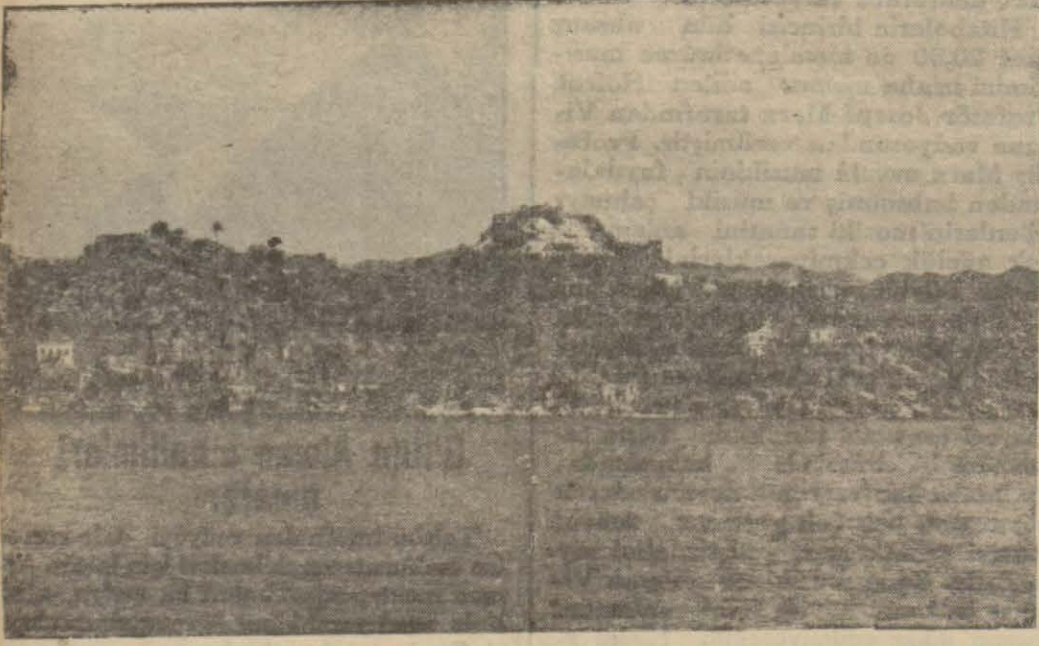
Uçağız limanı ve harabelerin uzaktan görünüşü

Kaş kazasının her köyü kadim devirlerin birer sanat kaynağıdır