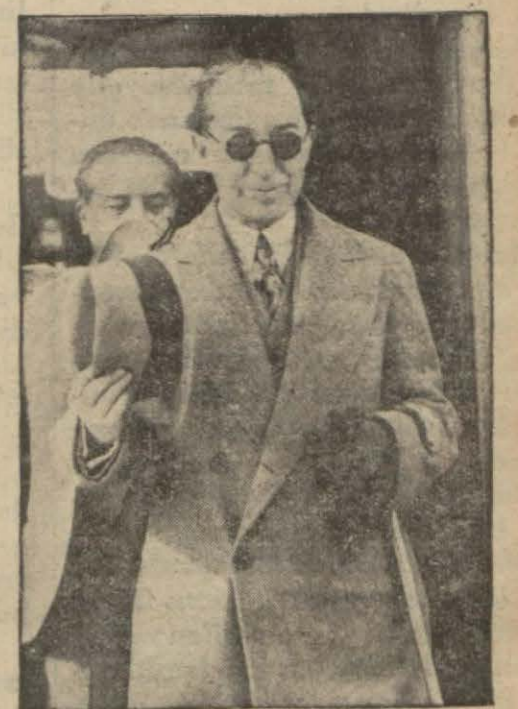
Hariciye vekili Tefvik Rüstü Bey Milletler Cemiyeti müzakerelerine iştirak etmek üzere bu akşam Cenevreye müteveccihen şehrimizden hareket edecektir.