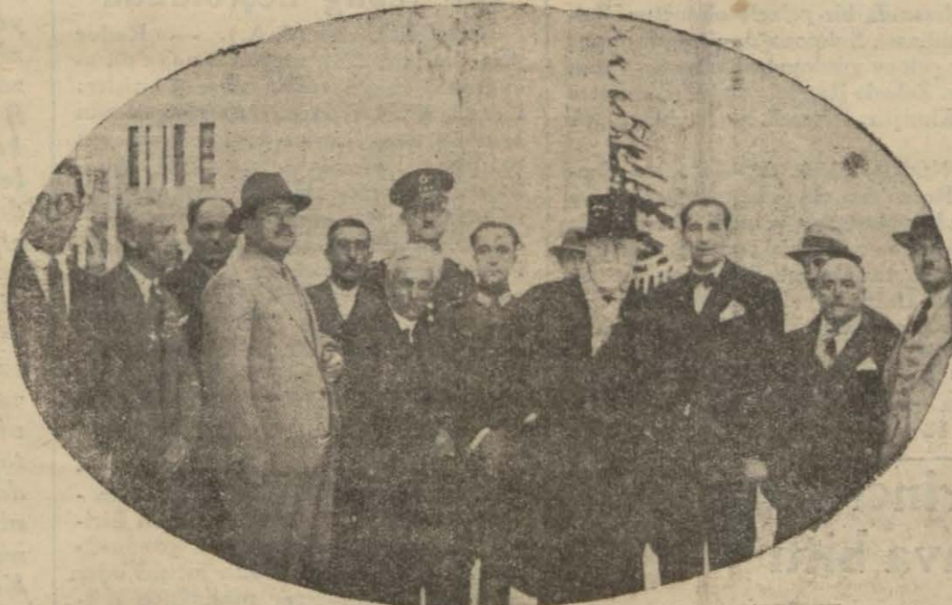
M. Venizelos, Gazi Hazretleri tarafından kabul edildikten sonra gazetecilerle görüşüyor..