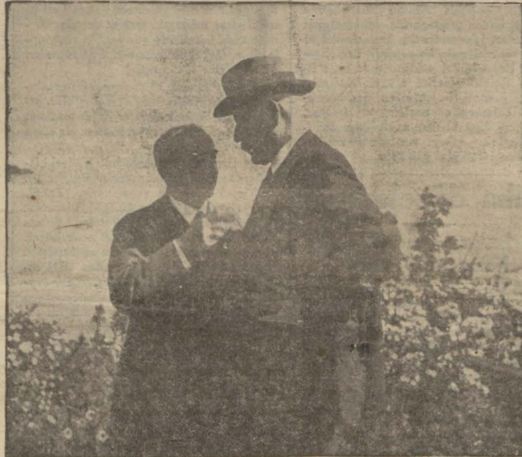
İsmet Paşa Hz. M. Muşanol ile Axin grad sarayının taraçasında hususi bir görüşme esnasında.

Yavuz, iskele ve sancak taraflarında gürleyen toplardan çıkan beyaz dumanlar içerisinde seyrine doyumaz bir manzara arz ediyor, göğüslerimiz kabarıyor, gözlerimiz yaşarıyordu.