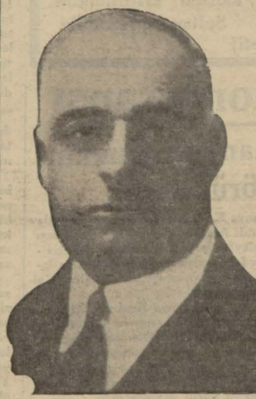
Izmit Valisi Eşref B.