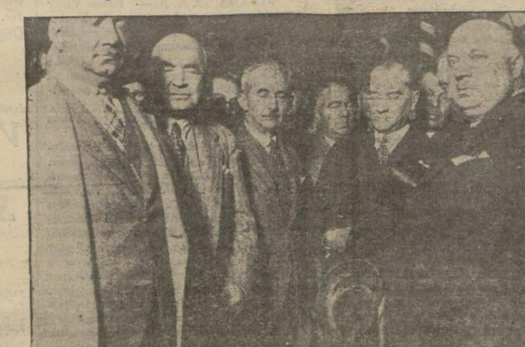
Reisicümhur Hz. istasyonda İsmet Paşa Hz. ni uğurluyorlar

Başvekil İsmet Paşa Hazretleri ile Hariciye vekili Tevfik Rüstü Bey dün sabah şehrimize gelmişler ve akşam Sofyadan gönderilen hususî trenle Sofyaya gitmişler ve istasyonda Gazi Hazretleri tarafından teşyi edilmişlerdir. Gazi Hazretleri evvelki akşam saat birde maiyetleri erkânı ile birlikte Ertugrul yatılı Derinceye giderek İsmet Paşayı karşılamışlardır. İsmet Paşa ve Tevfik Rüstü Bey sabah saat altıda Derinceye vâsil olmuşlar ve Ertugrul yatılı Dolmabahçe sarayına gelmişlerdir. Yatta Gazi Hazretleri uzun müddet Başvekil Paşa ve Tevfik Rüstü Beyle görüşmüşlerdir. İsmet Paşa Hazretleri akşama kadar sarayda kalmışlardır ve öğle yemeğini Gazi Hazretleriyle birlikte yemişlerdir. Başvekilin Sıhhiye vekili Dr. Refik Beyin vekâlet etmesi takarrür etmiştir. Bu sebeple İsmet Paşa dün Refik Beyle uzun müddet görüşmüştür. Tevfik Rüstü Bey saat 15,30 da Tokatlıyan oteline giderek bir müddet istirahat etmiş ve orada bulunmakta olan Dahiliye vekili Sükrü Kaya Beyle uzun müddet görüşmüştür. Tevfik Rüstü Beyin avdetine kadar Hariciye Vekâletine Sükrü Kaya Bey vekâlet edeceğinden, Tevfik Rüstü Bey kendisine vekâlet işleri hakkında izahat vermiştir. Sükrü Kaya Bey bu akşam Ankara'ya gidecektir. Tevfik Rüstü Bey, saat 17 ye kadar otelde kalmış ve tekrar Dolmabahçe sarayına gitmiştir.