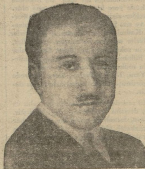
Riyasetiçümhur Kâtibumumisi Hikmet Bey

Ankarada kalan Besim Atalay ve Hâmit Zübeyir Beyler de anket komisyonunda çalışmaktadırlar. Bu komisyon gelen karşılıkları sıralamakta ve lûgatlara da bakarak ilk bir seçme yapmaktadır.