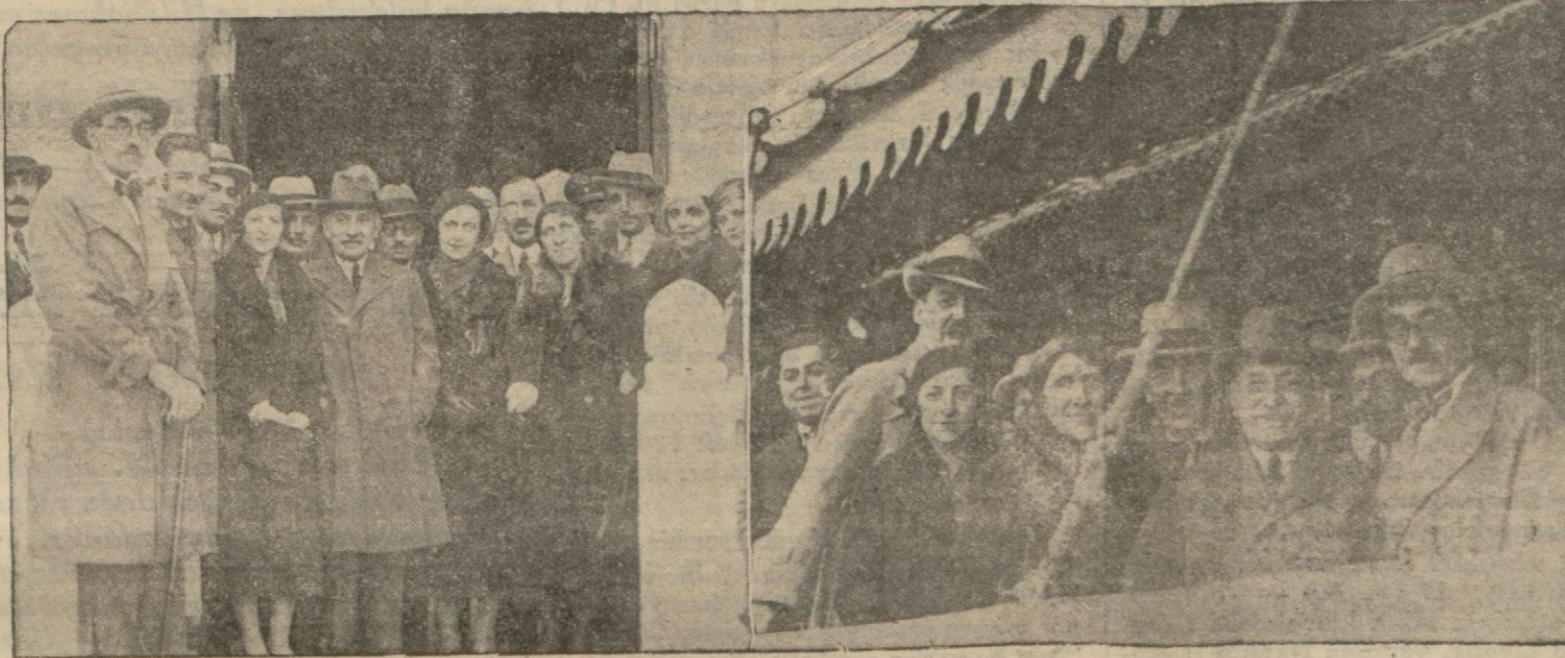
M. Çaldaris Ertuğrul yatında ve Elli kruvazörüne teşvi edilirken

Dost memleketin dost Başvekili ve misafirlerimiz dün gittiler Misakın Türk-Bulgar, Yunan - Bulgar münasebetlerine suitesir edecek hiç bir tarafı yoktur