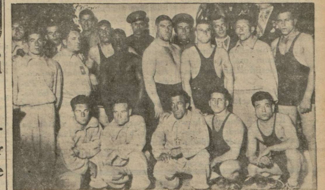
Türk ve İtalyan güreşçileri maçtan evvel bir arada..

Temps'da çıkan bu makalenin hülâsası ikinci sahifemizedir.