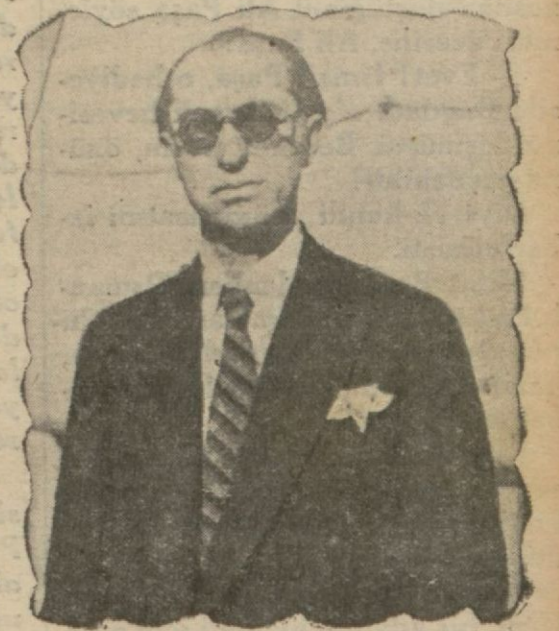
Hariciye Vekili Tevfik Rüstü Beyin yeni bir resmi

"1923 ten 1933 e kadar bu memlekette geçmiş olan şeylerin dünya tarihinde hiç bir misli yoktur. Bura pılan şeyler, Fransız inkılâbını, Faşist inkılâbını, Bolşevik inilâbını da geçmiştir. Çünkü Türk inkılâbı, yalnız siyasî teşkilâta, içtimai münasebata, dine, iktisadî hayata değil, aynı zamanda örf ve âdetlere ve cemiyetin manevî esaslarına da hücum etmiştir. Türk inkılâbı bir medeniyetten, diğer medeniyete giden bir geçittir. Bunun derinliği buradadır.."