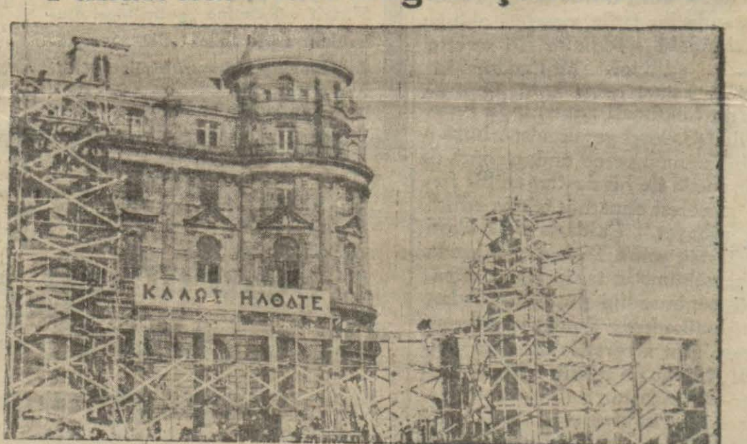
Haydarpaşada güzel bir tak yapıldı