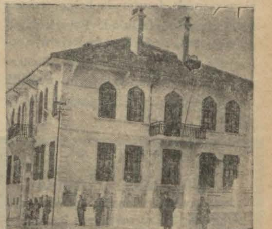
Ortamektebe tahsis edilen Bandırma belediyesi

BANDIRMA, (Milliyet) — Bandırmanın nüfusu senelerde fazlalalmış, mekteplerindeki talebe miktarı da o nisbette artmıştır. Şehir de dört ilkmektepten her sene yüzden fazla talebe çıkmaktadır. Bu talebelerin hepsinde okumak havesi olduğu halde ekserisi maalesef maddî imkânsızlık yüzünden, zengin talebe gibi İstanbul, Balıkesir, Bursa'ya gidip tahsillerini ilerletiyorlar. Mektepte perişan kalıyorlardı. Memleket bu acı hakikati görerek bir ortamektebi açılması hususunda Maarif idaresine müteaddit müracaatlarda bulunmuştu. Nihayet son gelen malûmata göre gelecek sene Bandırma'da bir or-