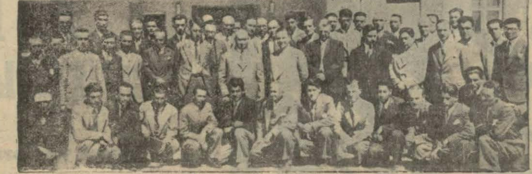
Köy muallimleri kursunda Ziraat Vekili kurs müdâvimleriyle beraber.