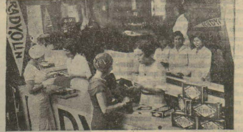
Radyolin pavyonuna koşan şık ve zarif hanımlar