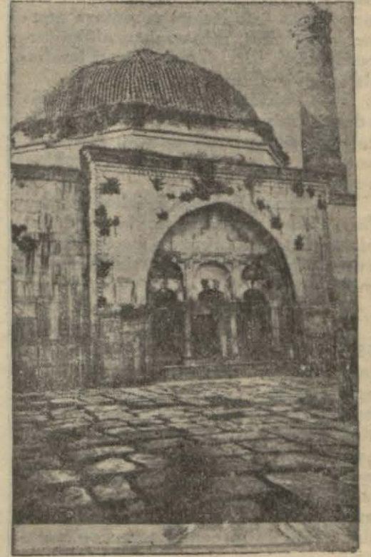
Balat köyünün Selçuklardan Balat camii

Cami kapısını üzerindeki kitabeye nazaran Metneşe Beylerinden Firuz ağanın eseri olup (806) tarihinde bina edilmiştir. Cami köyün alt kısmındadır, halen cuma ve bayram namazları kılınır. Takriben 225 metre murabbaıdır. Tuğla ile yapılmış büyük bir kubbe vardır. Minaresi zeminde tahminen dört beş metreden yukarı harap ve yıkılmıştır. Bu minare de tuğladan yapılmıştır. Türk asarı mimarisinin hakikaten iftiharla zikre şayan güzide bir nümunesi olan bir şaheseridir. Dört tarafı duvarla çevrilmiş olan bu camii binasının heyetiumumiyesinde (hariç ve dahilinde) hiç bir sıva yoktur. Sanki bir anıyı tanzir eden çok mahirane işlenmiş ve beş buçuk asırdan beri güzelliğine, taravetine halel gelmemekle beraber âdeta tabii-liğinden andran mütelevvin ve nakışlı mermer taşlarla vücudu getirilmiştir. Caminin bir kapısı ile on dört penceresi vardır. İç ve dış çerçevelerinin üst kısımları eski Türklerin sanat âleminde yarattıkları inçeliklerin kudret ve kıymetini teşhir eden çinilerle süslenmiştir. Kubbenin üzerinde senelerdenberi leylekler yuva yapıyor ve şimdiki kadar kubbenin hiç temizlenme-