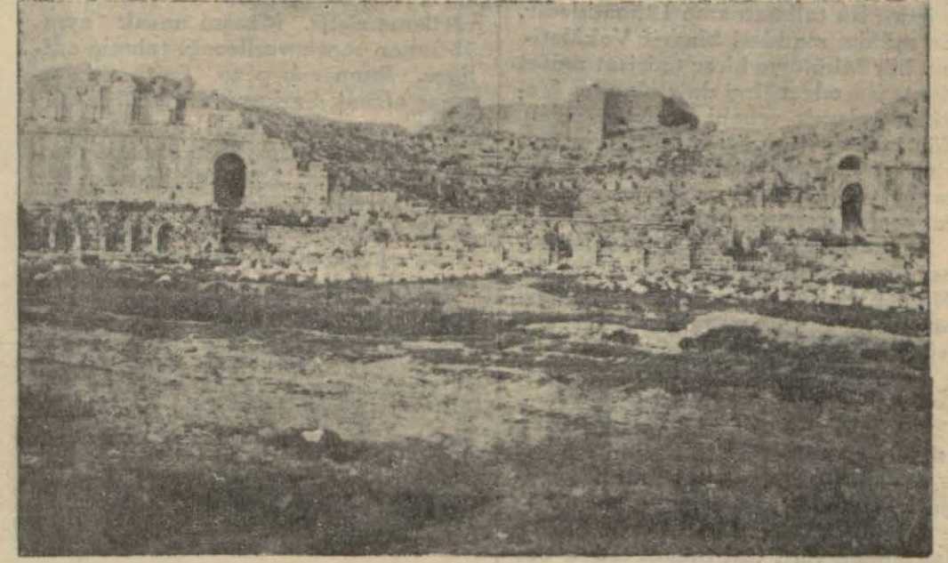
Milet harabelerinin den bir manzara

Sökenin Balat köyü civarında eskiden mamur bir şehrin harabesi var