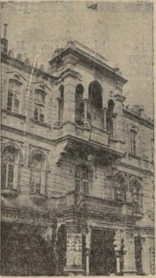
Samsunda belediye binası

Samsunun eski suyu olan "İrmak suyu", yalnız bahçe sulamalarında kullanılmaktadır. Fıçılarla Samsuna gelen "Kocadağı", suyu mühürlü tenekelele Samsuna getirilen "Unye", suyu, Çarşamba'nın "Emirhan", suyu, Havzanın kaplıca suları, Samsunda "iyi", olarak tanınmış "çimce" sularıdır. "Korcalaz", «kavaka» ve "park", suyunun biraz fazlaca kireçli olduğu dillerde dolayısıyla da bilhassa "park", suyunun Samsun için hayatı bir ehemmiyeti olduğunu kaydetmek lâzımdır. Şehir suyu çok ucuz olarak evlere muntazam saatlerle verilmektedir. Belediye her taraftan yangın musluklarından maada, bilhassa bütün halkın "park", daha doğrusu «şehir suyunun azami istifadesi için çok