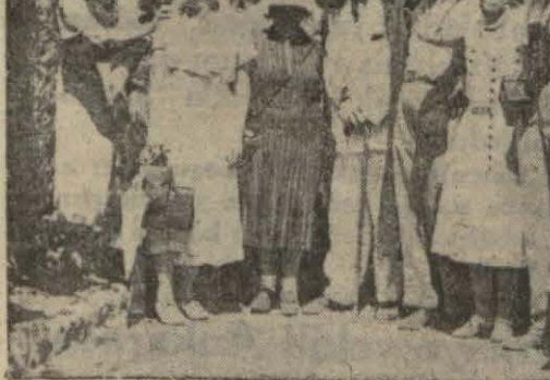
Şehrimizde bulunan İtalyan sey yahları Yerebatan sarayında.

"Bence, her hangi bir müsabakaya, kadın, cinsiyet farkı mevzu bahis olmadan dahil olmuş ve iştirak etmiş müsabaka neticesinde erkek ve kadın için ayrı ayrı haklar kabul edilmez. Madem ki hakem heyeti müsabaka başlamazdan evvel kadın ve erkek (Devamı 6 ncı sahifede)