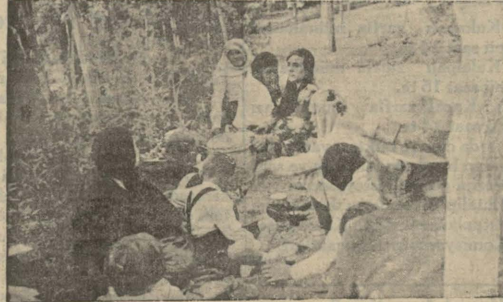
Orman çiftliğinde bedava kısımlar...