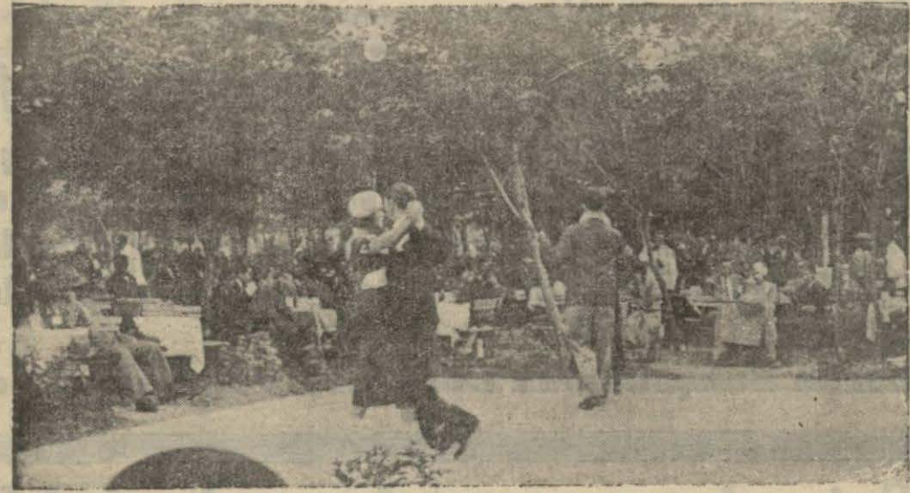
Orman çiftliğinde dansedenler...

Bütün bu faaliyet ve çalışmalar neticesinde Ankara daha 20 litrelik su kazanmaktadır. Bu miktar en kurak