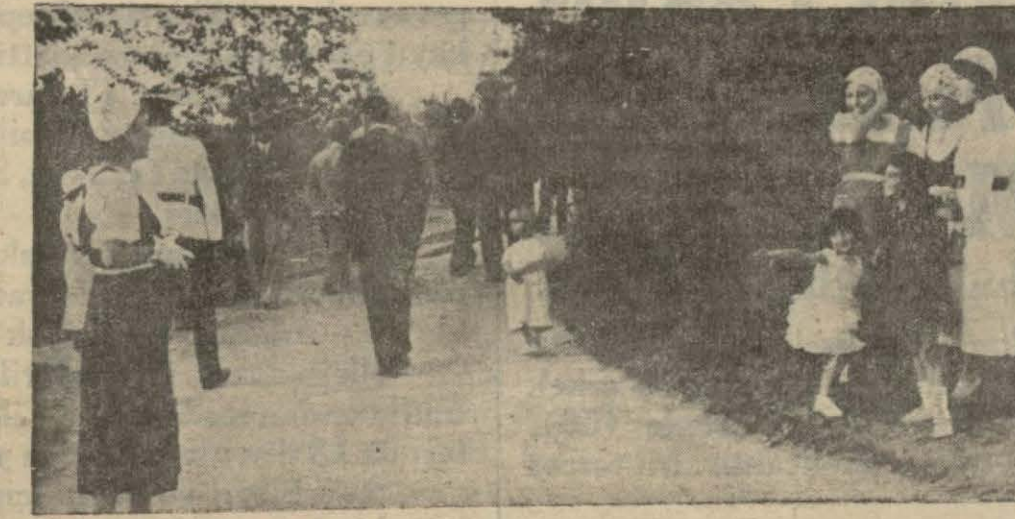
Meclis bahçe sinde cuma

ve suyun en az olduğu zamanda tespit edilen miktardır. Bu su Çankaya'daki depoyu beş altı saat içinde dolduracak bir kabiliyettir. Binaena-