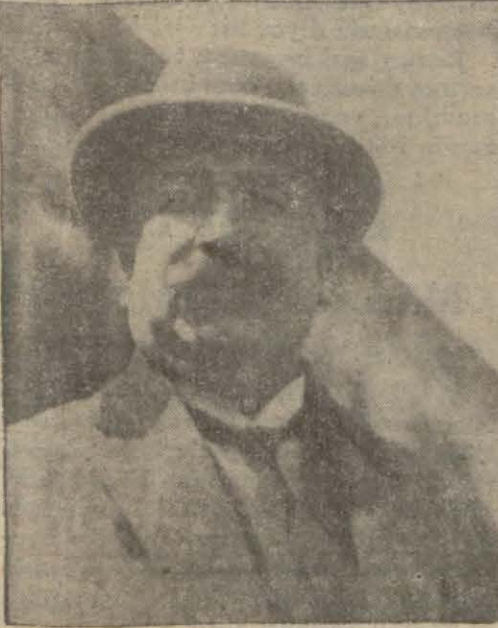
Mısırın sabık Türkiye sefiri Heddaya

Sefir kaçakçılık suçundan üç sene hapiste yatacak