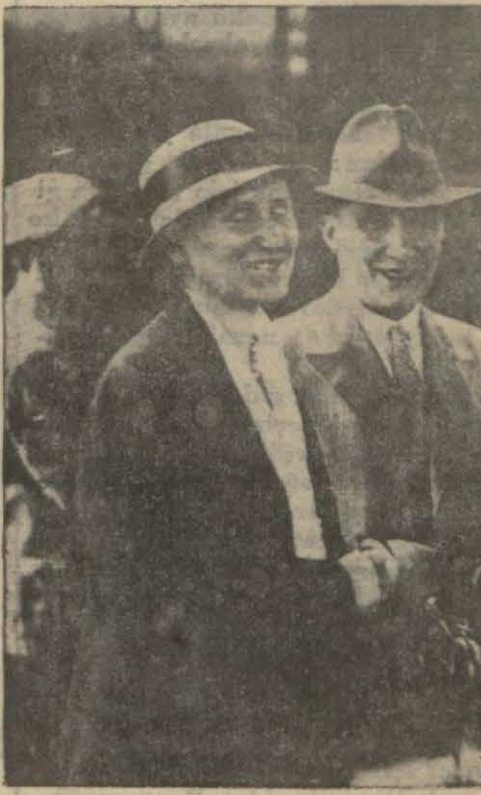
Dün gelen ecnebi müderrislerinden Pr. Breslau

hibi İhsan Bey 4x200 bayrak yarışını kazanarak birinci ve ikincilere madalya verilecektir. Bundan başlıca Moda deniz banyoları sa-