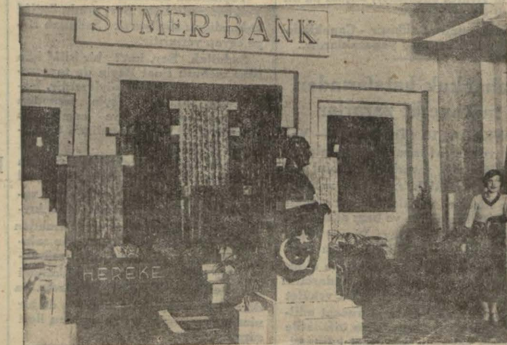
Sergide dünkü vitrin ve dekor müsabakalarını kazanan Sümer Bank pavyonu