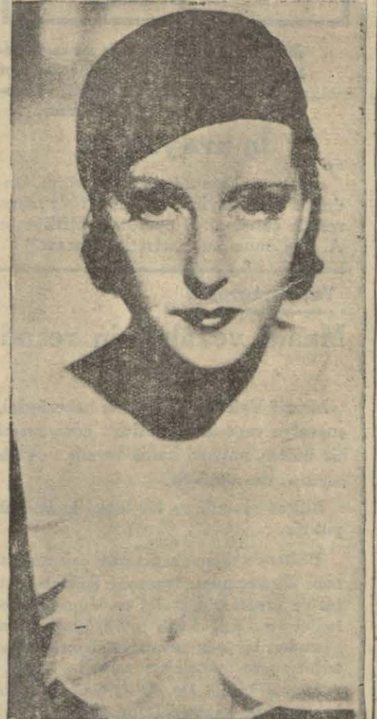
(Hollywood'ta bir Alman artisti daha: Dorothea Wieck (bu artist Mektepli kızlar filmindeki güzel muallime rolünü yapıyor)

Maurice le Bell isiminde bir doktor sıhhati ihlâl etmeğe nazıflamak için yeni bir usul bulmuştur. Bu usul nar suyu içmektir.