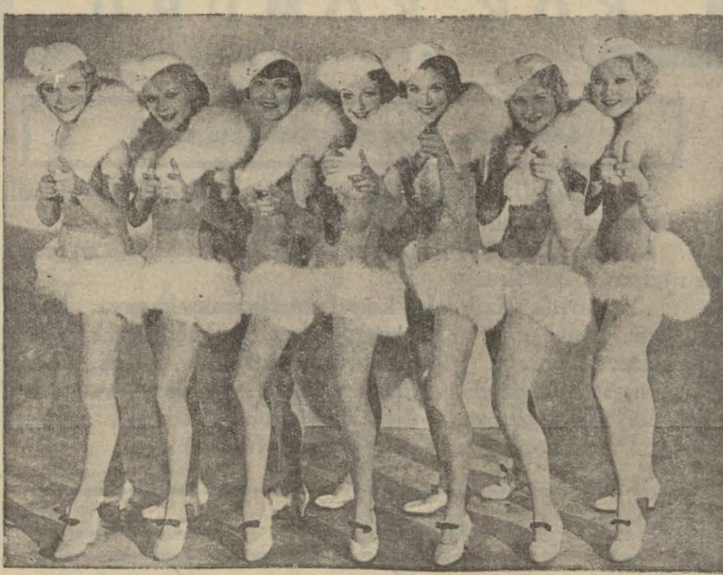
Stüdyolardan birinde revü kızlarından bir grup

hyacağımız zaman, su kapağı açıldı. Bu suretle içeriye basan su gemiyi fil miçvirmek için bize lâzım olan kırk beş dakikada batırabilirdi. Nasıl oldu, bilmiyoruz. Bu kırk beş dakika iki dakikaya indi. İki dakika sonra artistler, rejisör, operatörler hepisi su içinde idiler. En son suya batan diğeri üstündeki üçüncü operatördü. Bereket versin bizi sudan alacak olan kayık ve motorlar hazır, hepimizi sağ salım kurtardı, fakat bu kur tarış vaktinden çok evvel oldu.