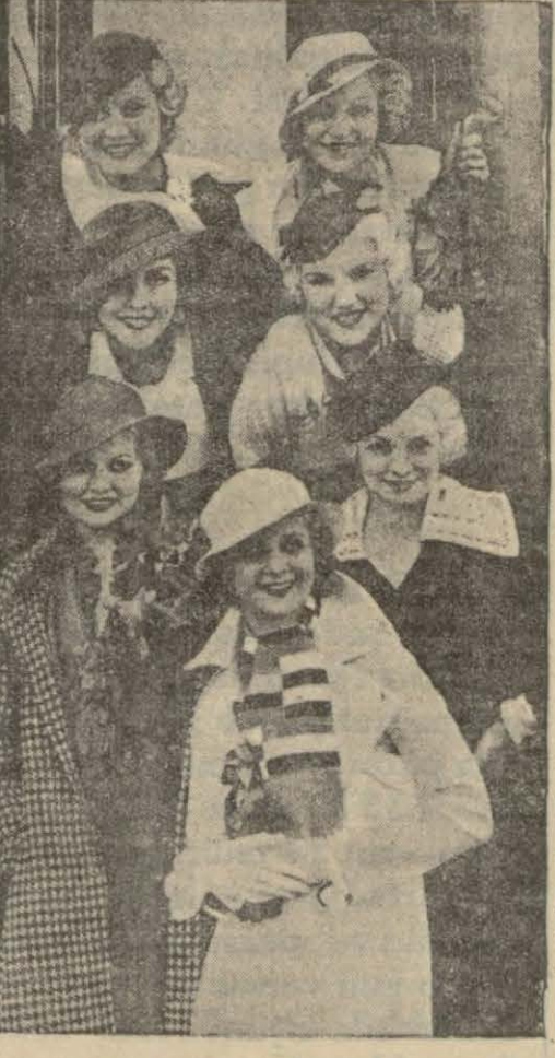
Amerikada Roman scandal isimle çevrilecek bir filme iştirak etmek üzere çağırılmış olan yedi en güzel Amerikalı kız. Bu kızların her biri fotoğraflara, resamlara, heykellere malâk olmakta ve deniz sü-

Bir ucunda sahneyi almak için bir operatör, öbür ucunda da mukabil sahneyi almak için başka bir operatör bulunuyordu. Filmi çevirmeye baş-