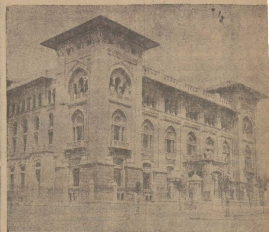
Ankarada Ziraat Bankası merkezi