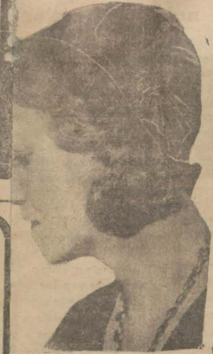
Kadifeden zarf bir kış beresi