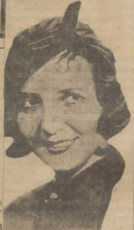
Keza kadifeden başka bir moda

Bir kaç güne kadar birinci nuna giriyoruz. Kış kaptırın an ay! İstanbul yazı ne kadar güzelse kışın da kendisimahsus hususiyetleri, eğlen