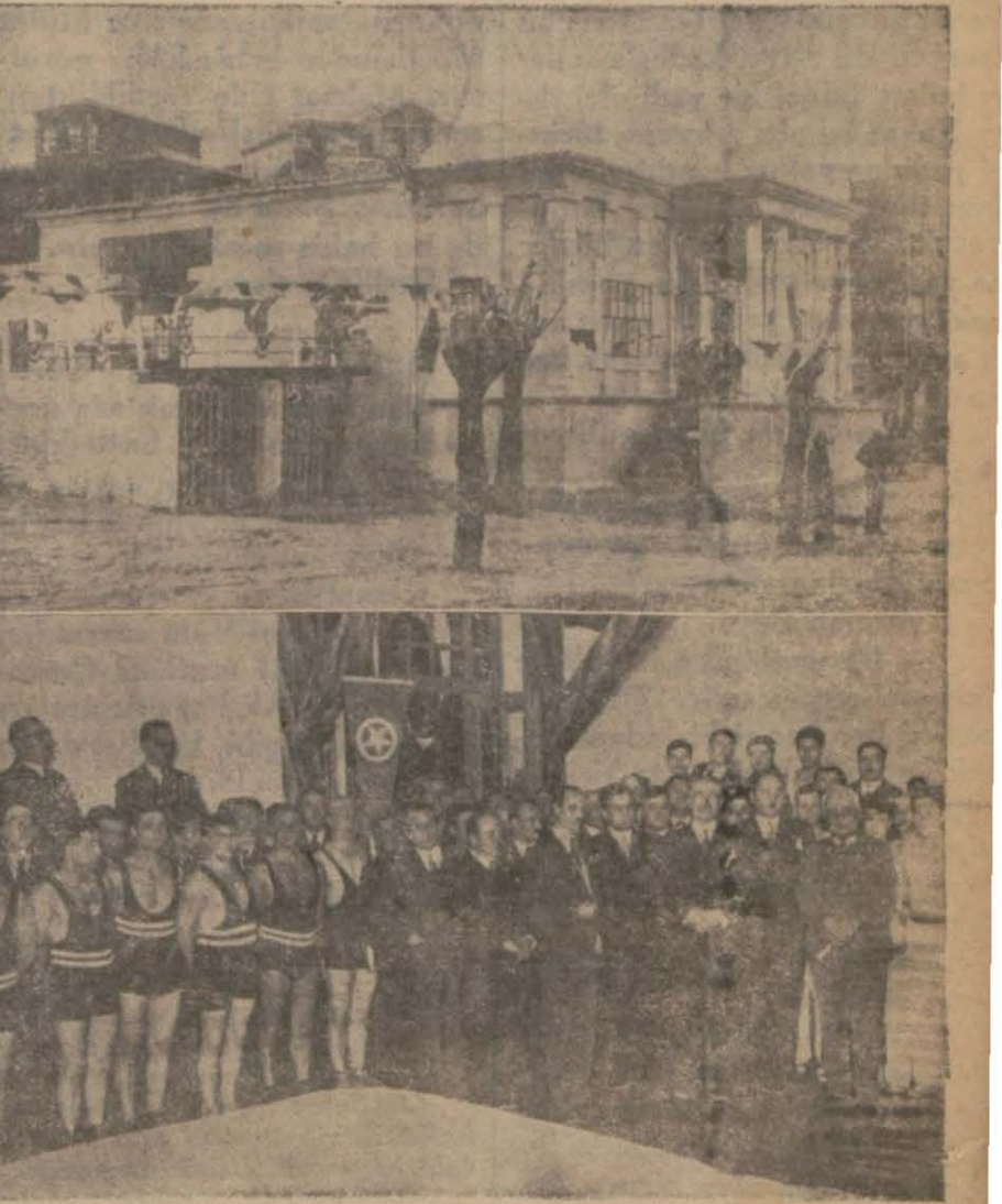
Yeni açılan Anadolu klübünün lokali ve resmi kılığatta bulunan zevat

Dün Galatasaray klübünde kendi voleybol şampiyonlarına devam edilmiş ve oyunlar büyük bir intizam içinde cereyan etmiştir. İlk oyun ikinci kategoriler arasında olmuştur. Pera ile Saint Michel takımları karşılaşmış ve birinci kısmı Pera 16 - 14 ve ikinci (Devamı 7 inci sahifede)