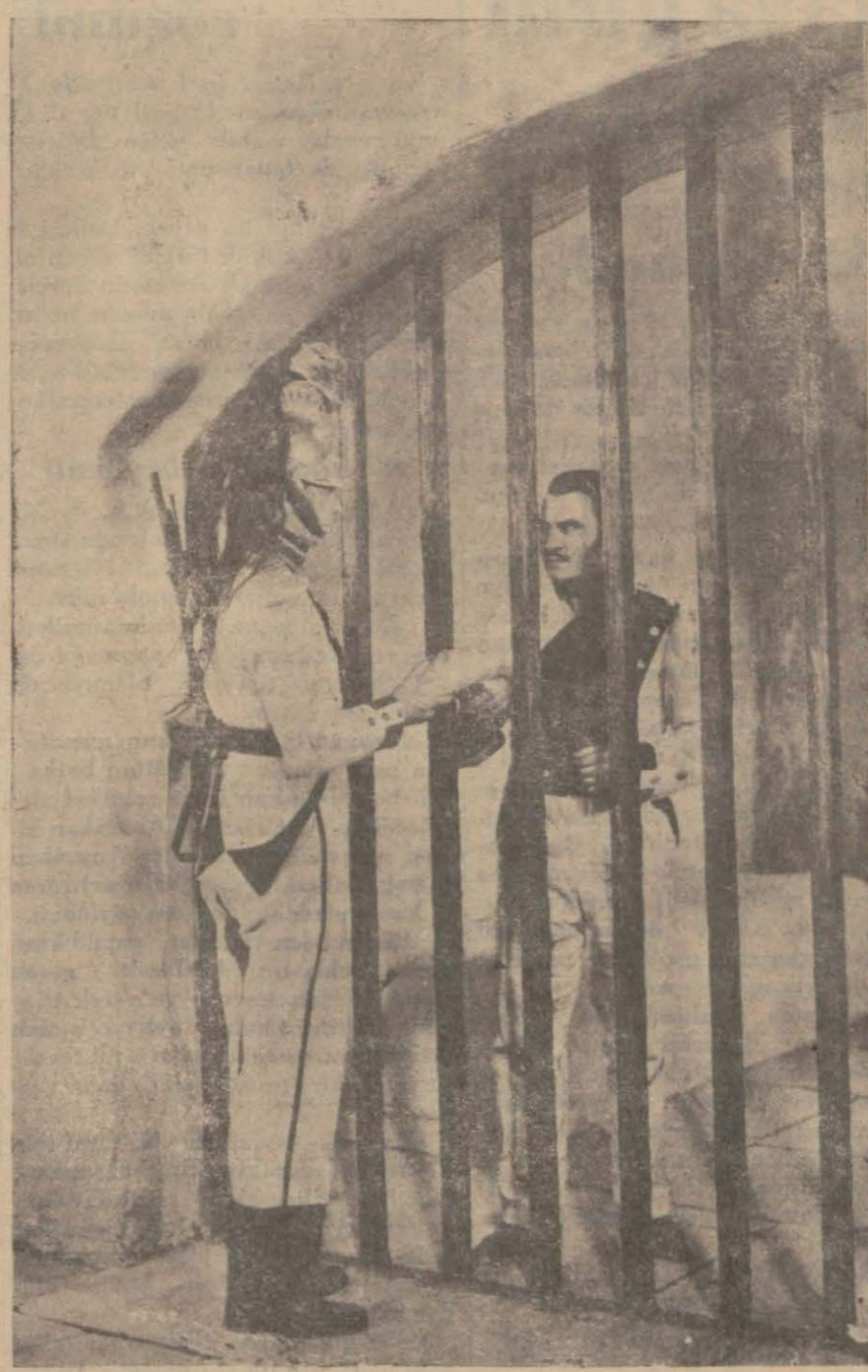
"Carmen", filminden bir sahne

Filmin en güzel kısmı, kâşifle-rin, boyları bir metreden fazla ol-mayan küçük neslin, PIGMELERİN sakin oldukları ormanları girdik-ten sonra başlar. Bunlarla çabuk dost olurlar, kendilerine sigara ve rirler. Fakat, nasıl olacaklar?...Bu muhitte çok sayanı dikkat ve ha-kiki bir aşk val'ası ve sevgililerin izdivaç merasimi tafsilâtle zap-tolunmuştur. PIGE'lerin âdet ve an'anatı fevkalâde calibi merak