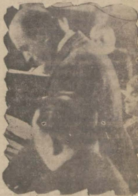
Belediye reisi mecliste izahat veriyor

— Terkos bedelini her sene taksitlerle ödeyeceğiz. 800 bin liranın da bir miktarını mübayaâ için ayırdık.