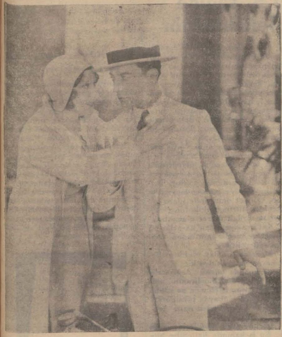
"Malek evleniyor" filminden bir sahne