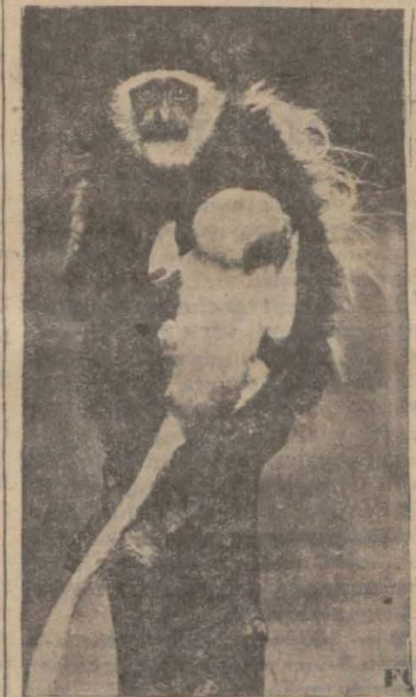
Kongorilla filminde gö-receğiniz mahlûklardan

Majik: Veda Busest Melek: Mavi Tuna Opera: Congorilla Artistik: Carmen Glorya: Malek evleniyor Alkazar: Vahşiler ara-sında Asri: Kadın güzel olunca Milli: İstanbul sokak-larında Hilâl: Emden