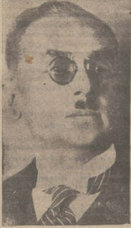
İktisat Vekili Celâl Bey

6 — Aylara tahsis edilmek üzere kontenjan listelerinde yazılı