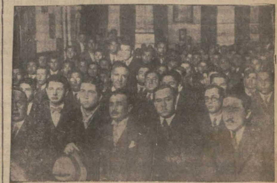
İlk hedef: İçti yerine meyveyi koymaktır.

bağlamaktadır. Maamafih bunlar sonra halledilecek işlerdir. Amerikanın (Devamı 6 ıncı sahifede)