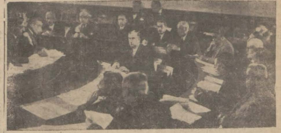
Şehir meclisi ıçtıma halinde..