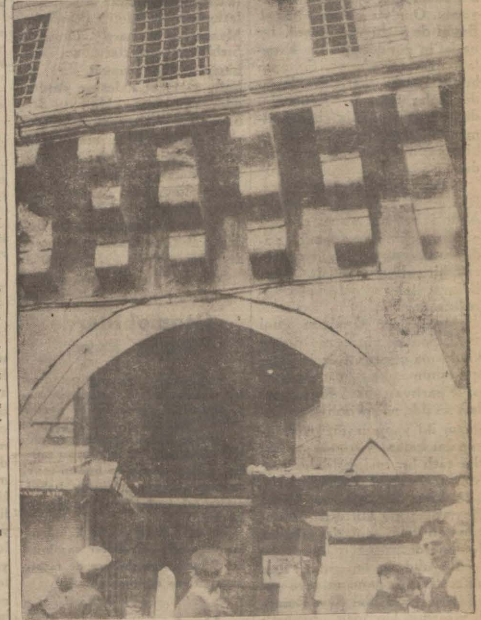
Resmimiz Mısır çarşısının kapanan kapısını ve taşları düğün yerlerini gösteriyor..