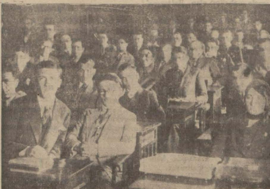
Yüksek İktisat mektebi talebesi dün kongresini yaptı. Resmimiz kongreye iştirak edenleri gösteriyor