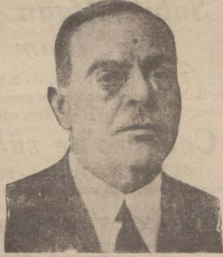
Istifa eden Yunan Hariciye Nazırı M. Rallis

ATINA, 13 — Kabinenin beyannamesi hakkındaki müzakere, dün bitmiştir. Hükümet fırkaları, itimat reyini vermişlerdir. Liberal fırkası, mahdut müsa-