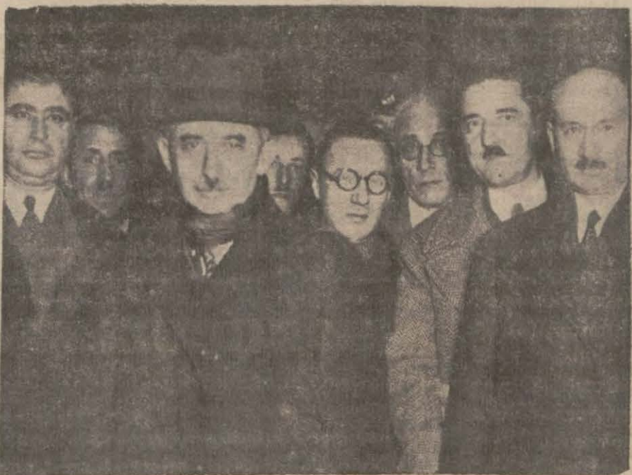
Başvekil hareketten evvel teşye gelenler arasında

Haydarpaşada mülkî ve askerî erkân tarafından teşyi edildi