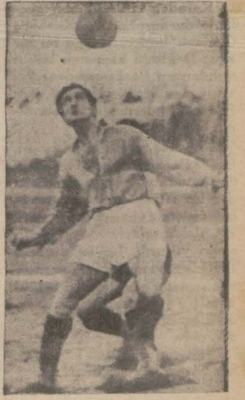
Dün nisbeten iyi oynayan Suphl maç esnasında

İki maç yapmak için şehrimize gelen Leviski takımı dün Taksim stadyumunda Galatasarayla karşılaştı ve faik bir oyundan sonra 0 - 2 galip geldi. Bulgar milli takımına beş oyuncu veren Leviskililerin dün en kıymetli elemanlarından mahrum olarak oynayan Galatasaraylılara karşı aldığı bu neticeyi tabii bulmak lâzım gelir. Dünkü oyun umumiyet itibarile durgun ve zevksiz oldu. Epey zmandan beri takım halinde oynamayan Galatasaraylılar maçın devamı müddetinde boca ladılar ve âhenksiz bir oyun oynadılar.