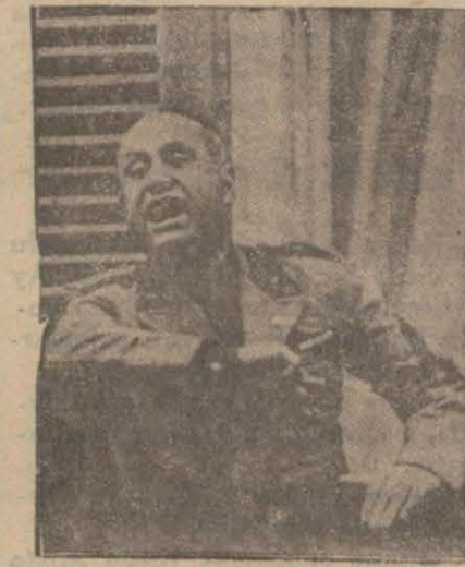
İtalya Başvekilî M. Mussolini cenapları

"Bir sene evvel söyledim borçlar işi üzerine sünger çekmek zamanı gelmiştir"