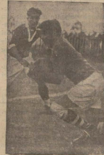
Dün Taksim stadyomunda Rus misafirlerimizle Halkevi spor takımı ikinci maçını yaptı. Bu maçlar dost iki devletin sporcularını karşı karşıya getirdiği için

Ruslar :4. H. S: 0., Yunanlılar:3 Pera:1