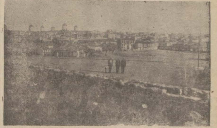
Bozcaadadan bir manzara

Bütün adada dört milyon üzüm kütüğü bulunuyor