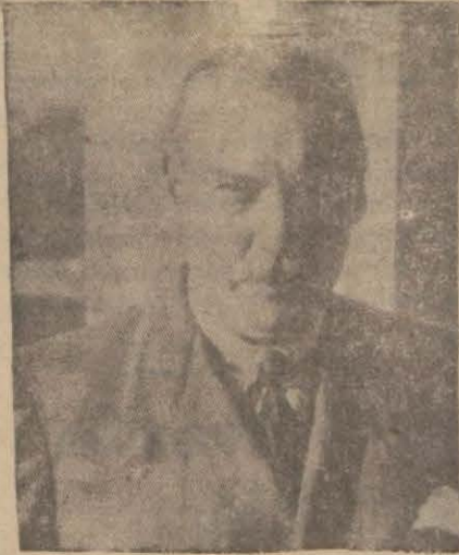
Fransız sefiri Kont Döchambrun cenapları

İtilâfnamenin yakında imzalanması muhtemeldir