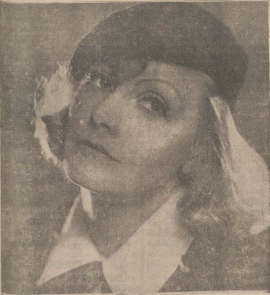
Bir sırrı daha anlaşılan meşhur Greta Garbo

Hollywood'a dönüşünde haftada 25000 lira alacak.