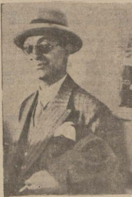
Tevfik Rüştü Bey yavın İstanbul muhabirinin mektup (Devamı 6 ncı sahifede)

Madenlerimizin bugünkü ve yarınki mukadderatı hakkındaki hükümleri, gündelik bir ma-