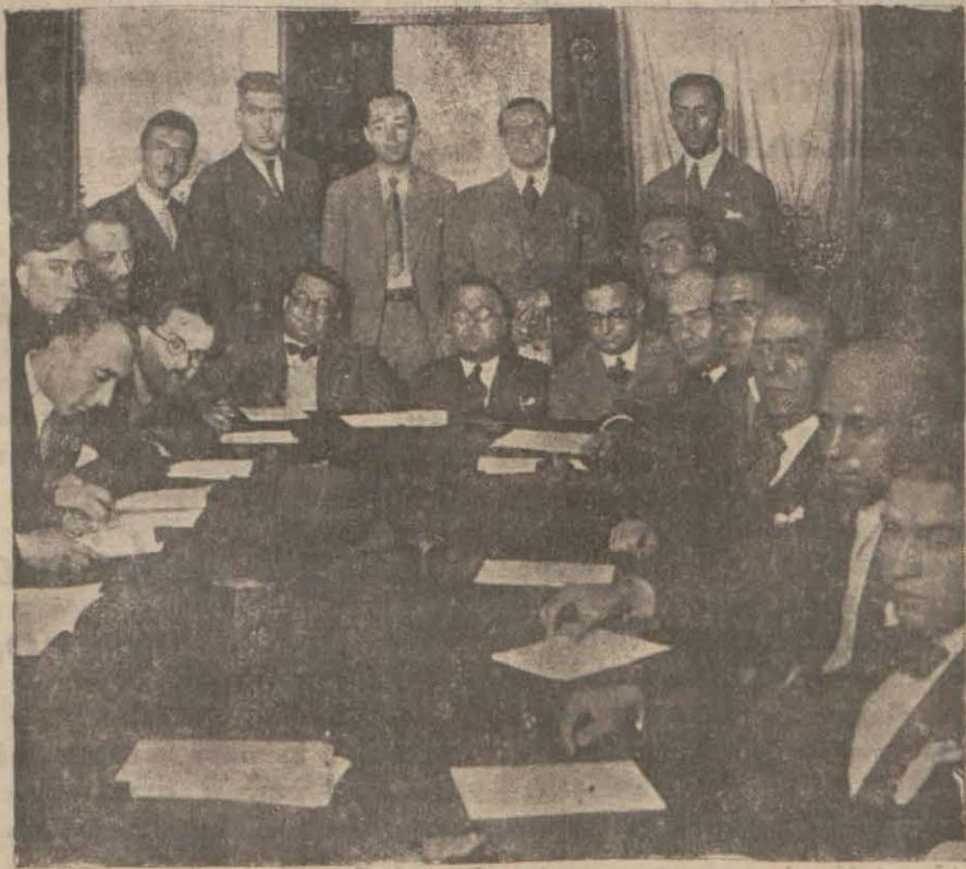
Gazetecilerin dünkü kongresi

Matbuat istilâhlarının derlenmesi için bir heyet seçilecek