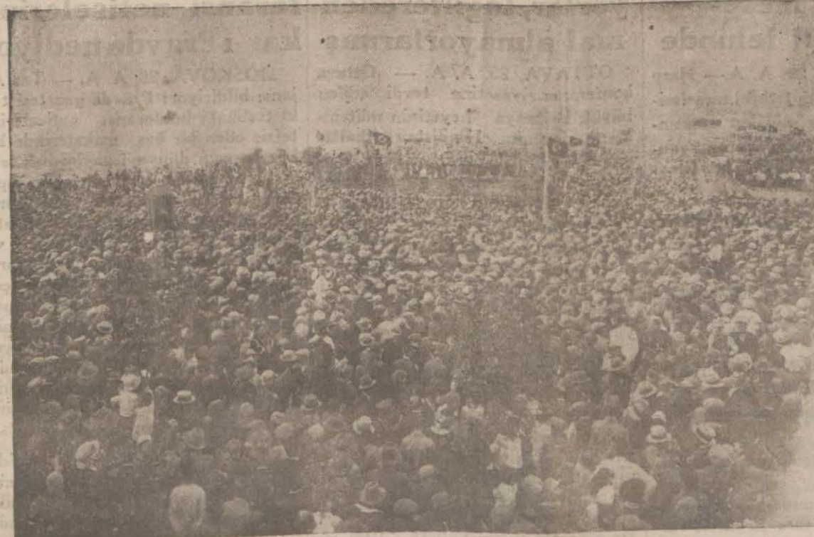
Başvekil mikrofon karşısında nutuk söylerken kendisini heykelin etrafında dinleyen on binlerce halk