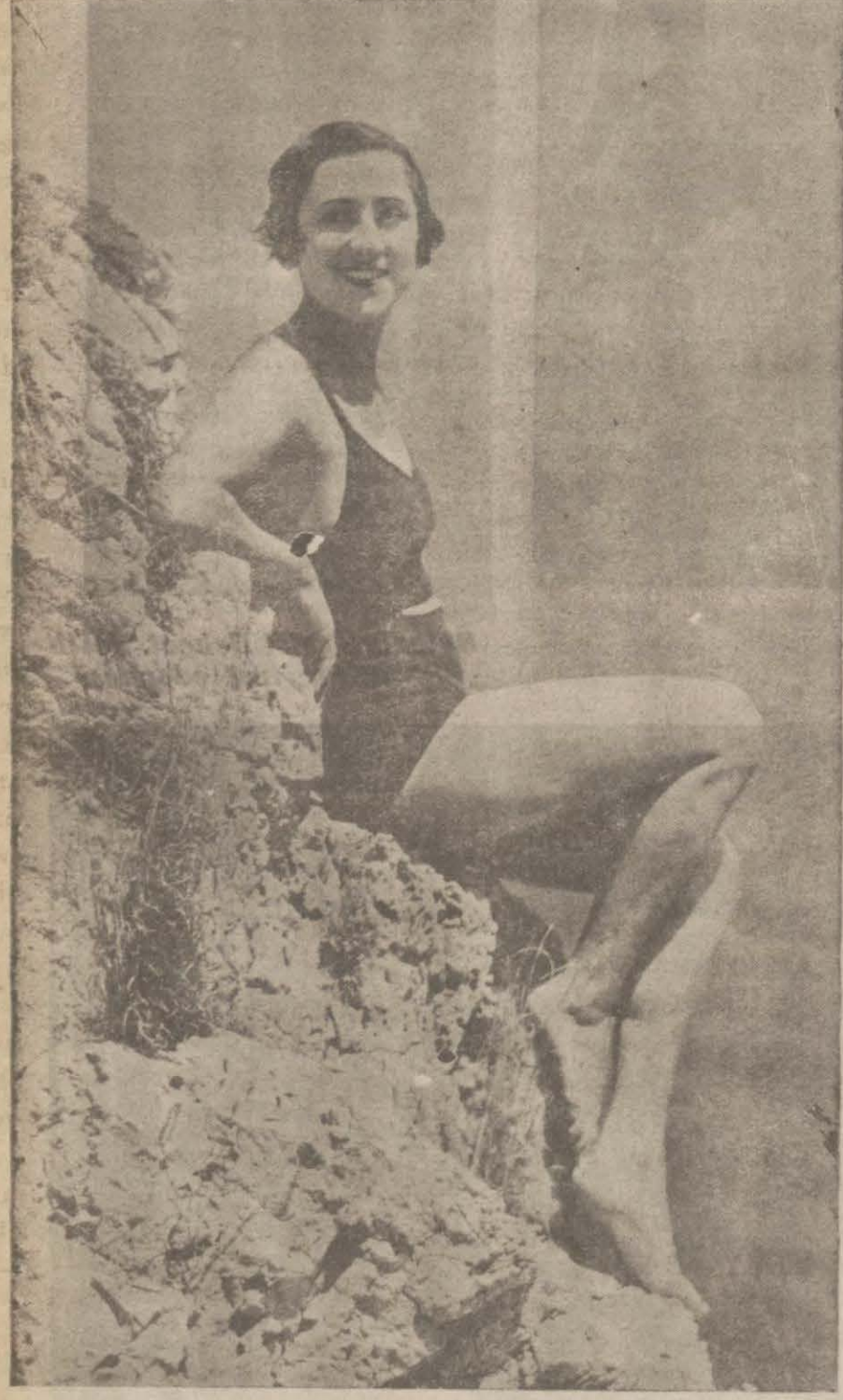
Fransız artistlerinden Blanche Montel

Sesli film den sonra bir nevi yeni artist zümresi daha türedi