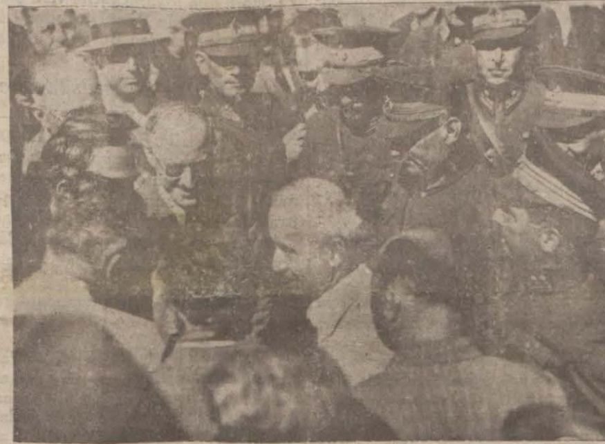
Nutkun dinlenmesi için meydana konulan radyo otağı Başvekil vapurdan indikten sonra müstakbillerin ellerini sıkıyor

Diğer taraftan Vali muavini Ali Rıza, belediye reisi muavini Hamit Beylerle Cumhuriyet Halk fırkası vilâyet idare heyeti ve kazâ reisleri iş motoru ile Ege vapuruna istikbaline çıkarak İsmet Paşa Hazretlerini selâmlamışlardır. Bir çok zevat daha saat ikide İsmet Paşa Hazretlerini istikbal için Galata rıhtımını doldurmuş-