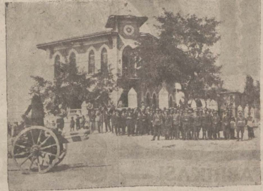
Babaeski belediye dalresi önünde Zafer tayranı

Türk gençleri bu Türk köylere dağılmalı ve oralarda yaşamaya alışmalıdırlar