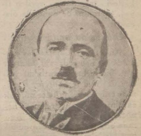
Adliye vekili Yusuf Kemal Bey