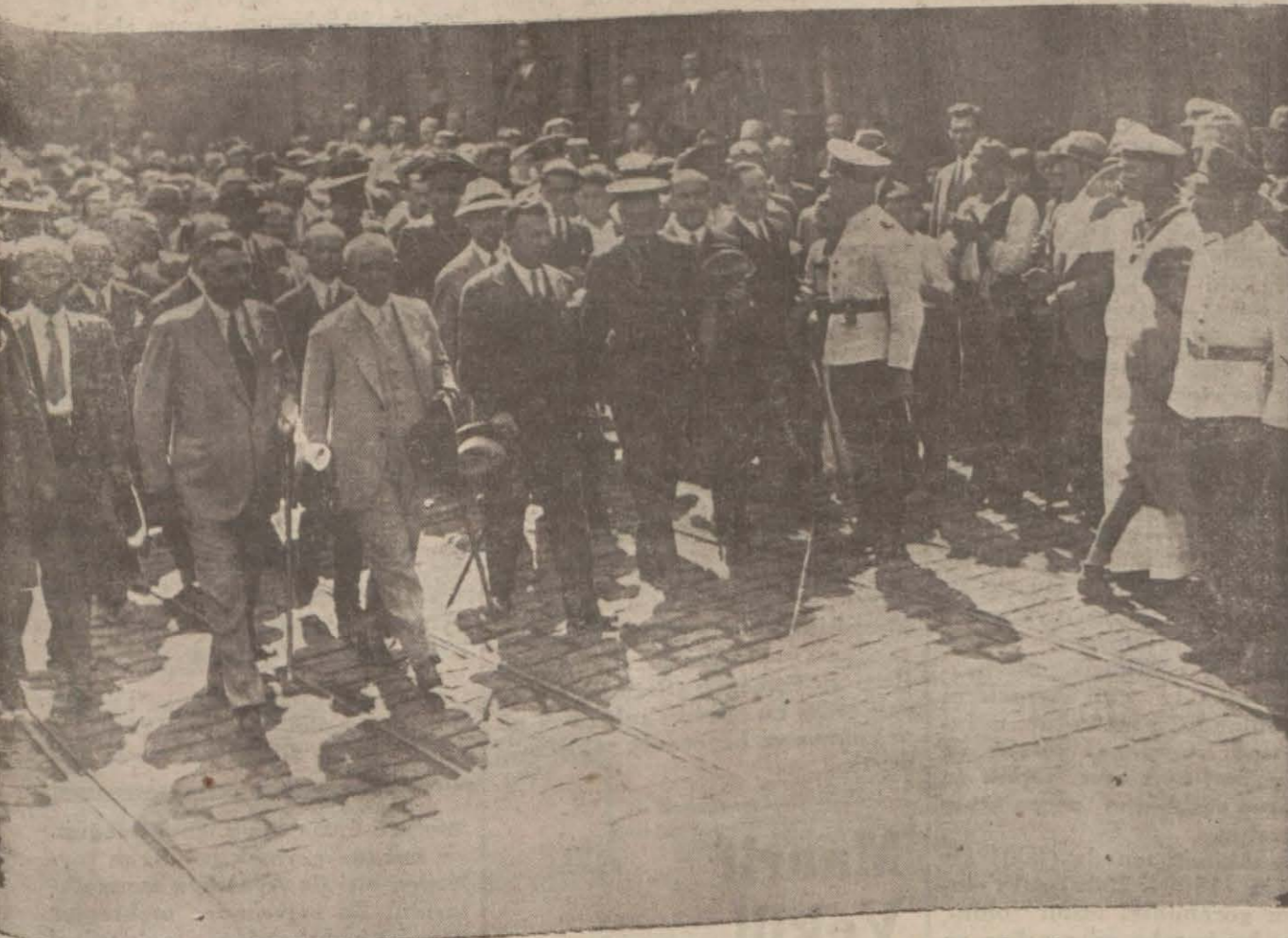
Başvekil vapurdan çıktıktan sonra istikbale gelenler