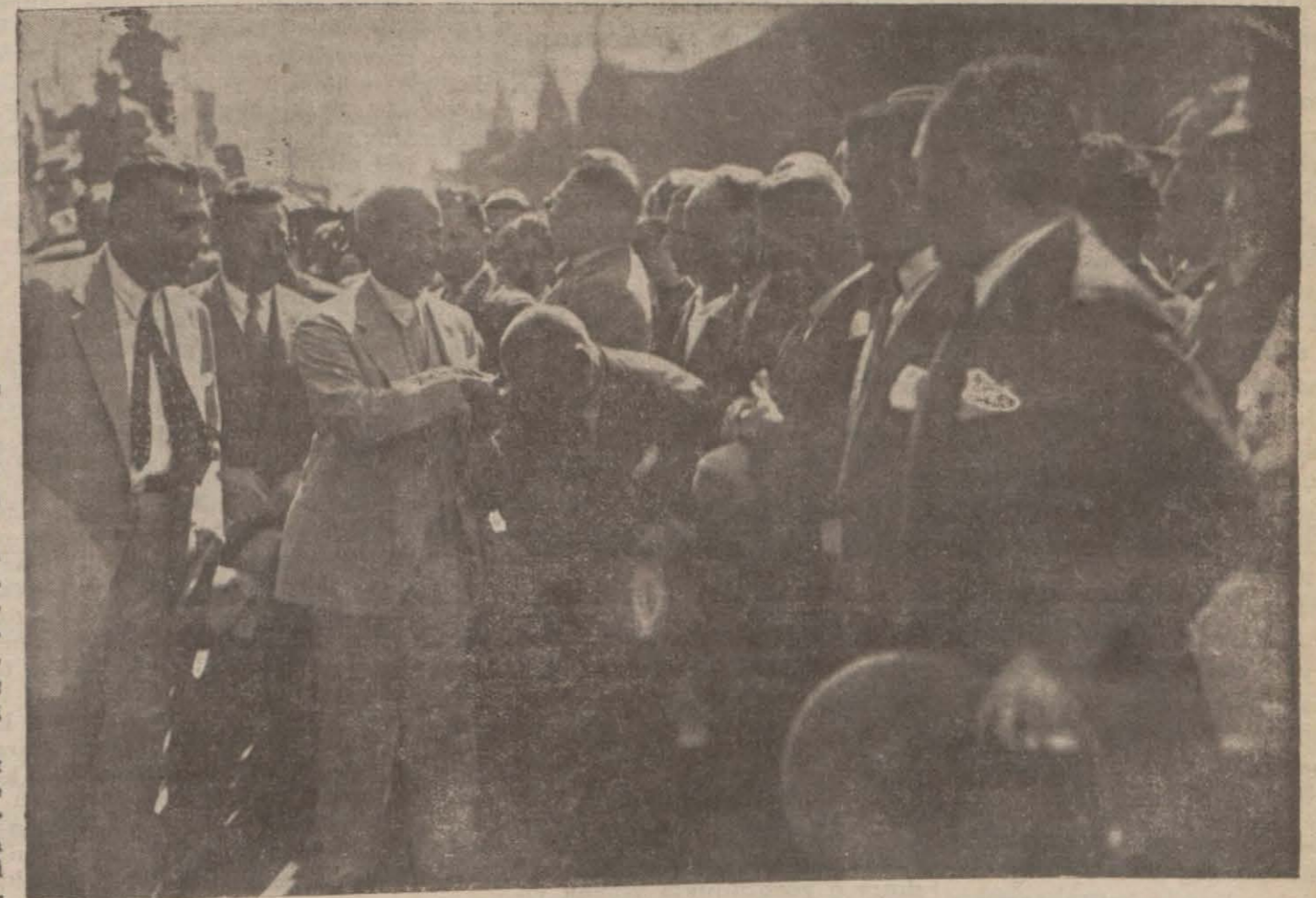
Başvekil İstanbul rıhtımında müstakbilin aarasında