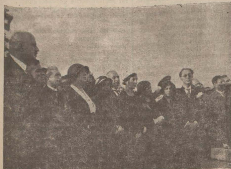
Pasanın nutku dinlenirken