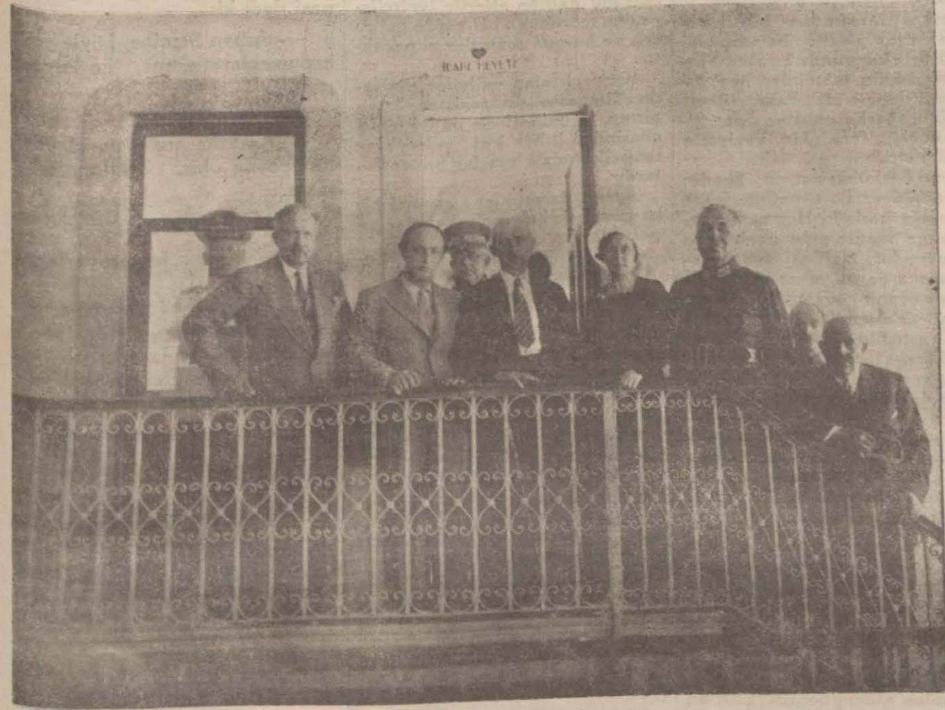
Başvekil öksüzler bakım yurdunda

İsmet Paşa Hazretleri iki saat kadar biraderlerinin köşkünde kalarak iskeleye avdet etmişler ve orada kendilerine intizarda bulunmakta olan Tevfik Rüştü Bey, Şükrü Kaya ve Zekâi Beylerle birlikte Yalovaya gitmişlerdir.