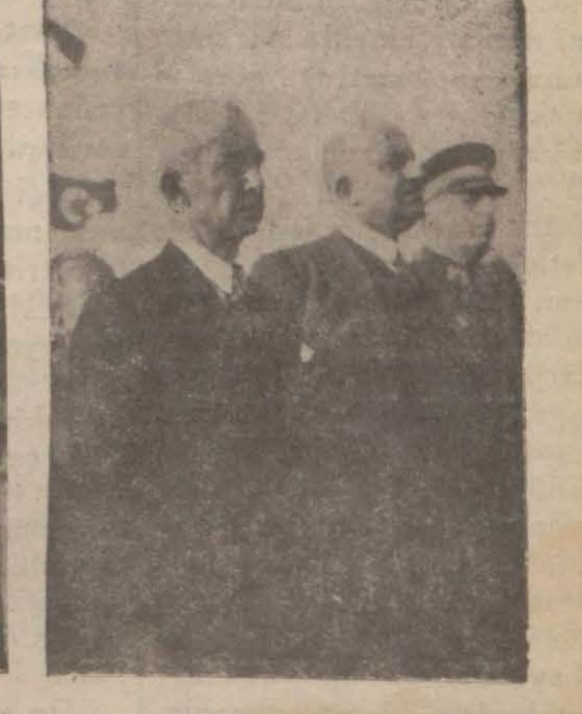
Başvekil belediye reisinin nutkunu dinlerken