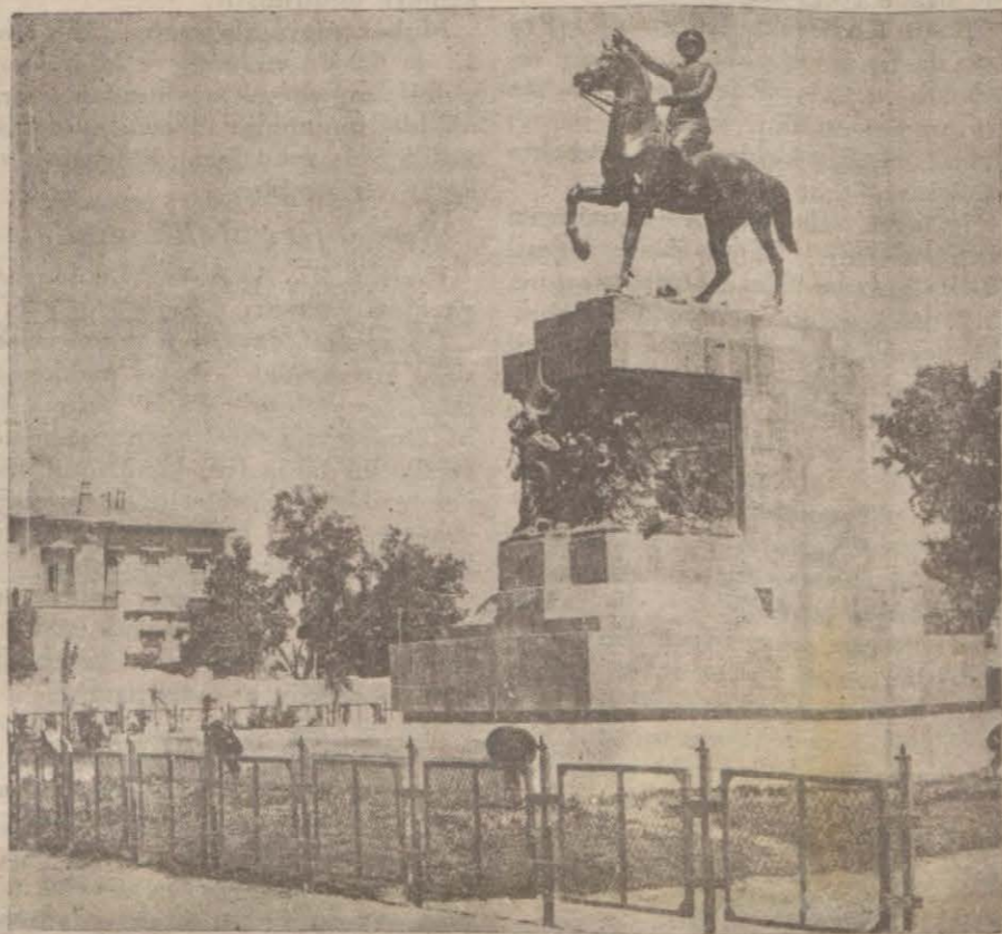
Resmî kışadı İsmet Paşa tarafından yapılan Gazi heykeli..

devlet adamı olduğu malum olduğuna göre, İtalyanın harici siyasetinde de şefin usullerine uygun bir tebeddül beklenebilir. Beynelmîlel parlamentolar konferansındaki hâdiselere İtalyanın teşkilâtın çekilmesi de bu yeni hassasiyetin bir tecellisi olarak kabul edilebilir.