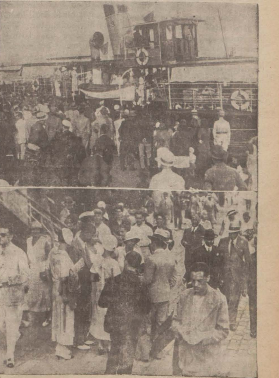
Seyyahlar Şirket vapuru ile rıhtıma çıkıyorlar..