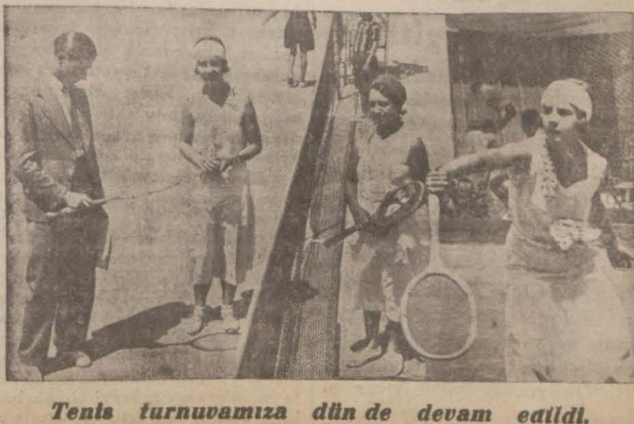
Tents turnuvasında dün de devam etti.

murlardan Nahit, Şakir, Ziya Beyler müfettiş muavinliğine, üçüncü sınıf müfettişliğine de birinci sınıf müfettişlerden Sadi Bey tayin edilmiştir. Birinci tasarruf heyeti azasından Şerif B. Evkaf dairesinde (Devamı 5 inci sahifede)