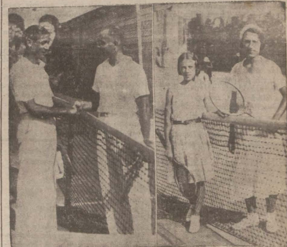
Suat-Serdar maçında galiple mağlûp el sıkışırken

Finale kimlerin kalabileceği aşağı yukarı bir tahminle sağı günü anlaşılacaktır