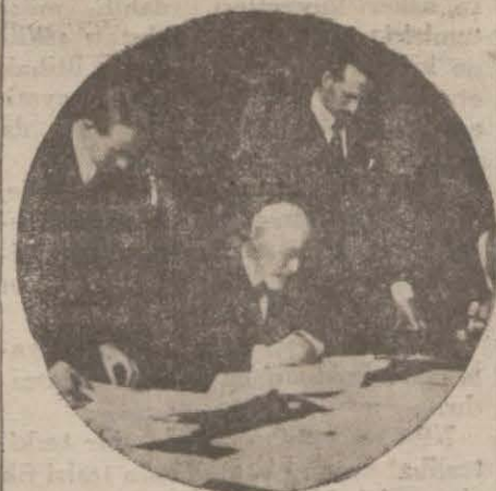
M. Venize'os muahedeyi imzalıyor.

başlayan müzakere 24 temmuzza kadar sürdü. Bugün Lausanne günüdür. Tam