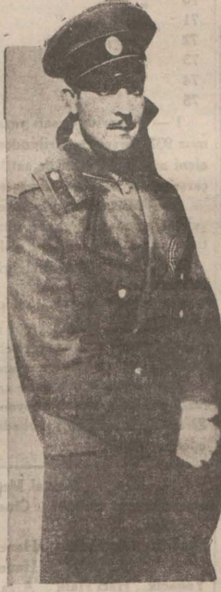
Ramon Novarro'ya her elbise yakışıyor

Ramon Novarro iyi bir sporçudur. Mükemmel yüzür, mükemmel tenis oynar. Fakat her şeyden evvel sinemayı sever. Sayfesinde sesli bir sinema salonu vardır. Söylenildiği gibi insanları