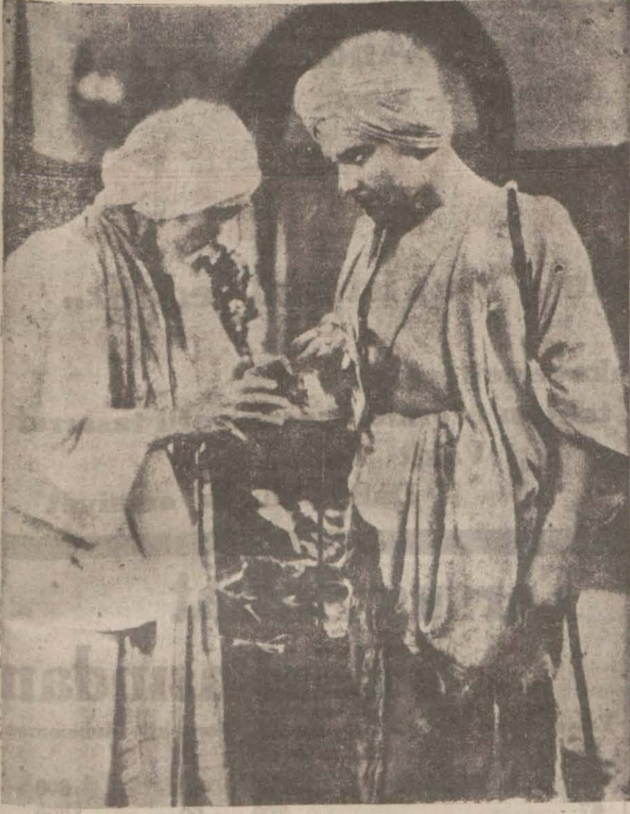
Ramon Novarro en son çevirdiği "Mihracenin oğlu," filminde..

Eski lokanta garsonu şimdi dünyanın en mes'ut adamı..