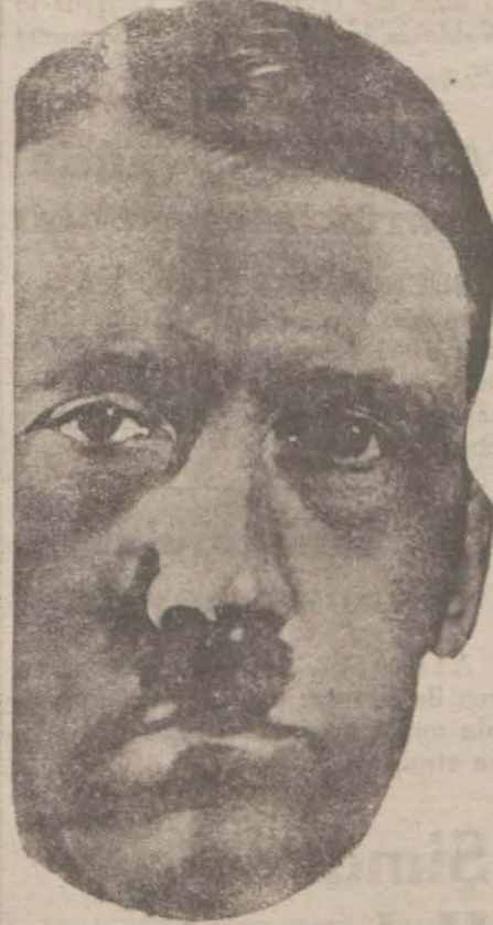
Son tedbirlerin alınmasında müessir olduğuna şüphe edilmeyen Hitler

Asayiş bozmağa kalkacak insan tecem. mularına karşı ateş açılacak.