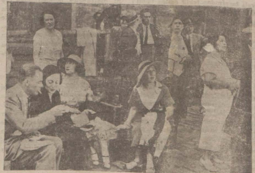
Gelen seyyahlardan darülfünunlular

Dün şehrimize muhtelif vapurlarla bir çok ecnebi seyyah gelmiştir.