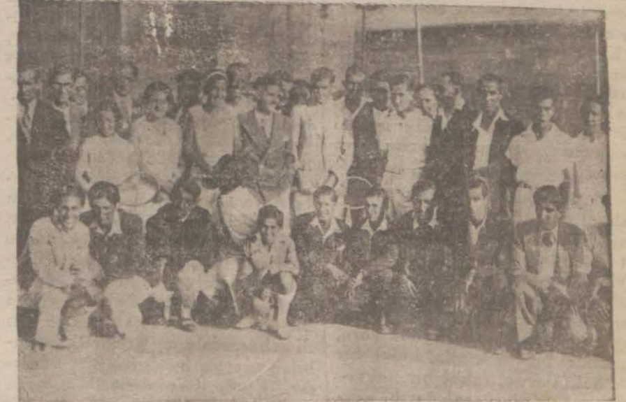
Turnuvasımıza iştirak edenlerden bir kısmı

Müsabakalar çok hararetle, heyecanlı ve canlı oluyor