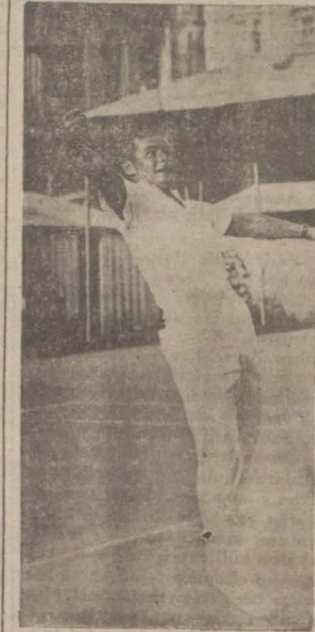
Single erkeklerden bir enstantane

Dün 1932 teni turnuvasına Takimdeki Tawn tenis kulüpte başlandı. Müsabakalar tam saat ondan itibaren büyük ve gü-