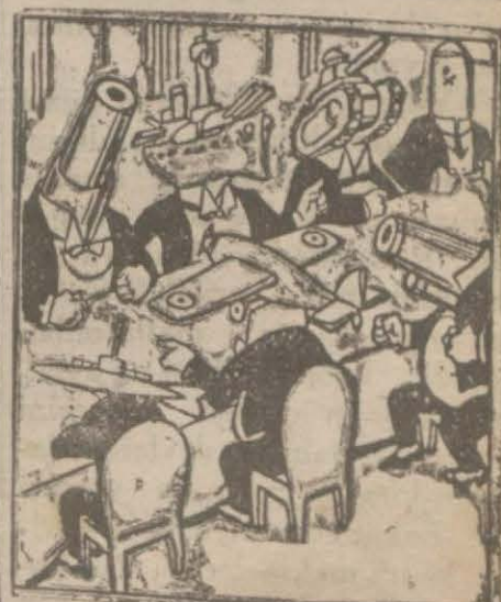
Terki teslihat konferansından bir oaise

Ankaralıların akımı ile oyun başladı. İstanbul biraz ağır basıyor ve Ankarayı sıkıştırıyor ve iyi (Devamı 2 inci sahifede)