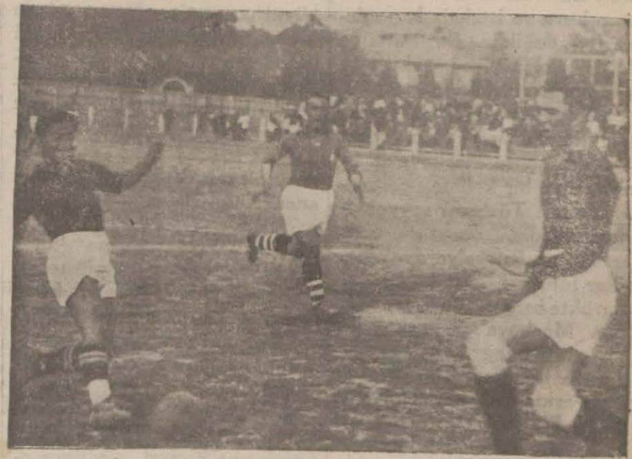
Kaleci topa doğru çıktığı sırada gol

PARİS, 15 .A. — Hükümet af hakkındaki kanun lâyihasını meclise tevdi etmiştir.