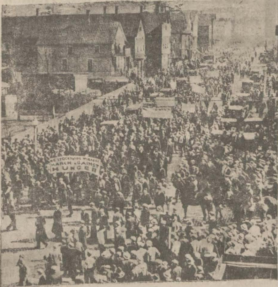
İşsizler Vaşington üstüne yürüyorlar

Eski muhriplerin Vaşington'a yürüyüşleri ile bu hadise arasında bir irtibat var mı? Amerika'da ekmeğ kavgası