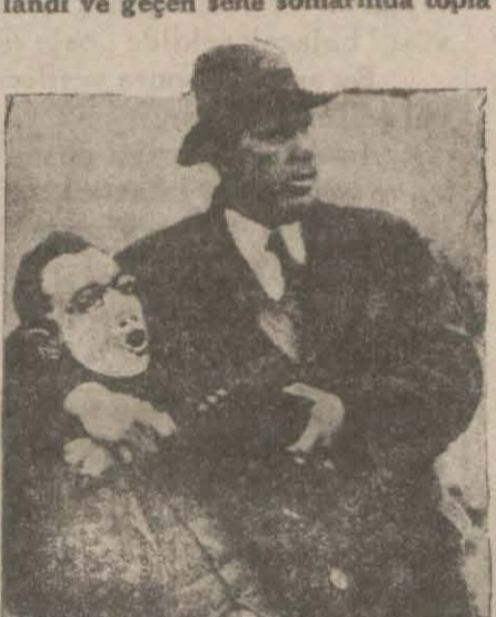
Bir nümayişçi tevki ediliyor

Bu toplantın nasil vukua geldiği de iyice malûm değildir. Bazıları komü nistlerin ön ayak olduklarını söylüyorlar. Şu var ki eski muhripler, her türlü siyasi kanaatler haricinde, saf tahsisat koparmak için toplıyorlardı. Bu ordu bir ay evvel toplandı ve geçen sene sonlarında toplandı.