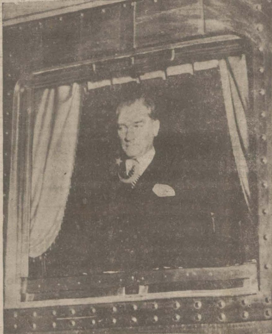
Gazi Hz.'nin geçen seneki teşriflerinde alınmış resimlerinden..

Büyük Reis Ankarada samimî tezahürlerle teşyi edildi