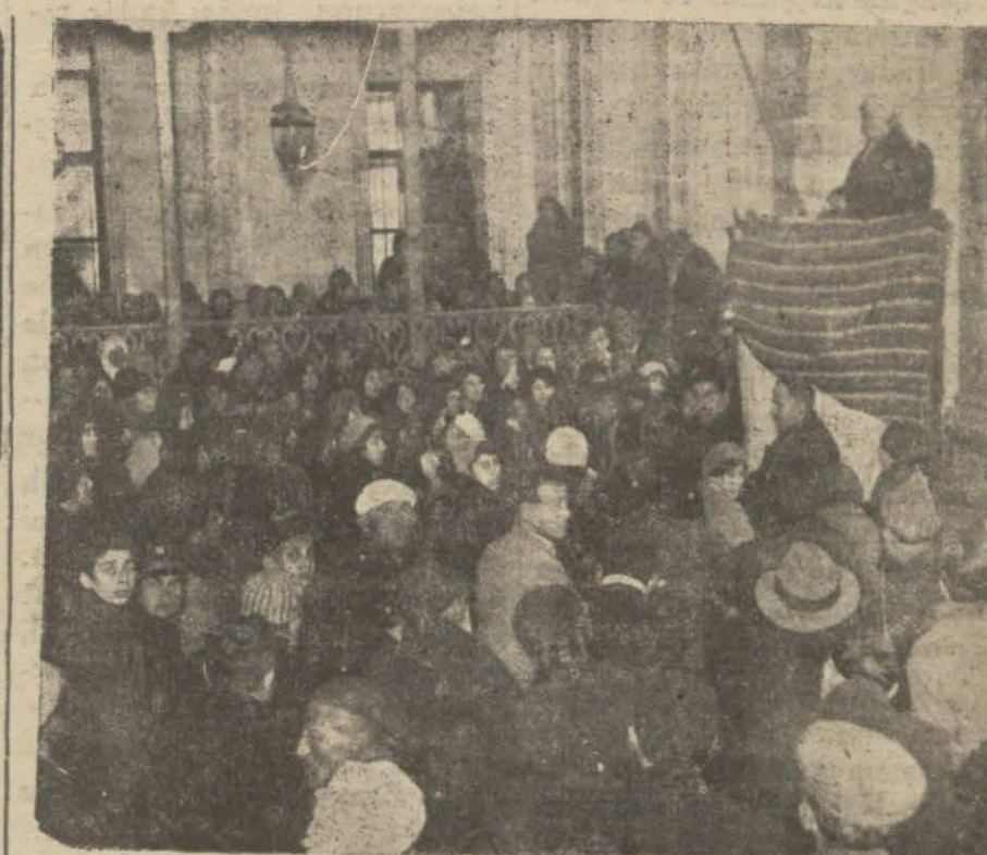
Kadıköyünde Osmanağa camiinde türkçe Kuran dinleniyor.

Kazalara mani olmak için caddeler-böyle lavhalar konuyor. Bu onlar-dan bir tanesidir.