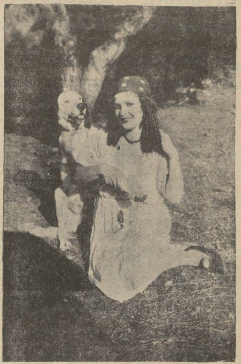
Kaçakçılar filminden bir sahne