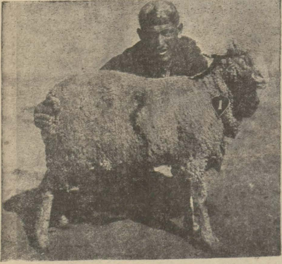
Bursada yetiştirilen ve sergide mükâfat kazanan yerli Merinos koyunlarından güzel bir tip.

Ancak bunların yetiştirilmesi için izalesi lâzım gelen bazı mâniler var