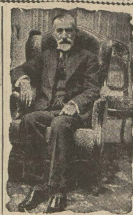
Büyük Türk Şairi Abdülhak Hamit B.