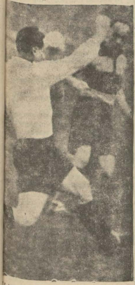
Maçın en heyecanlı anı. Viana takımının da en iyi futbolcu olan Blum ve Bunyan karşı karşıya

Maç çok heyecanlı olmuş ve çok zevkli takip edilmiştir