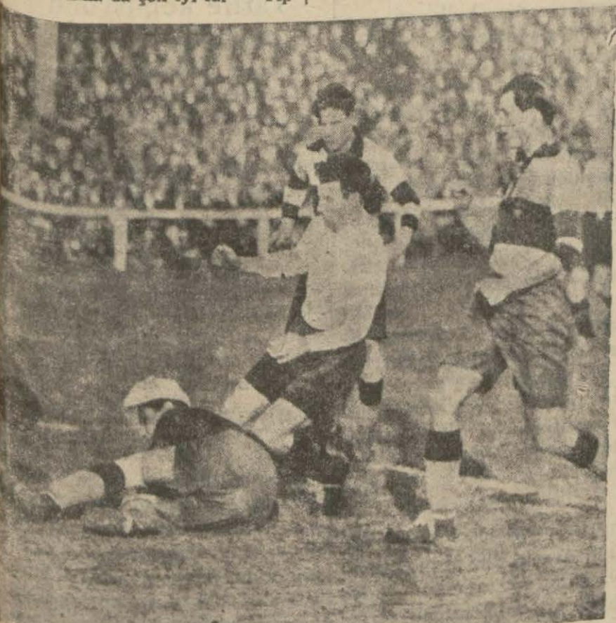
Viana - Paris maçından bir an. Vianalılar ilk gollerini atıyorlar

Bu şerait dahilinde 5 — 1 neticesi anormal olmaktan uzaklaşır. Paris takımının oyunu ve sür'atini 20 dakika da çok iyi idi — Tip-