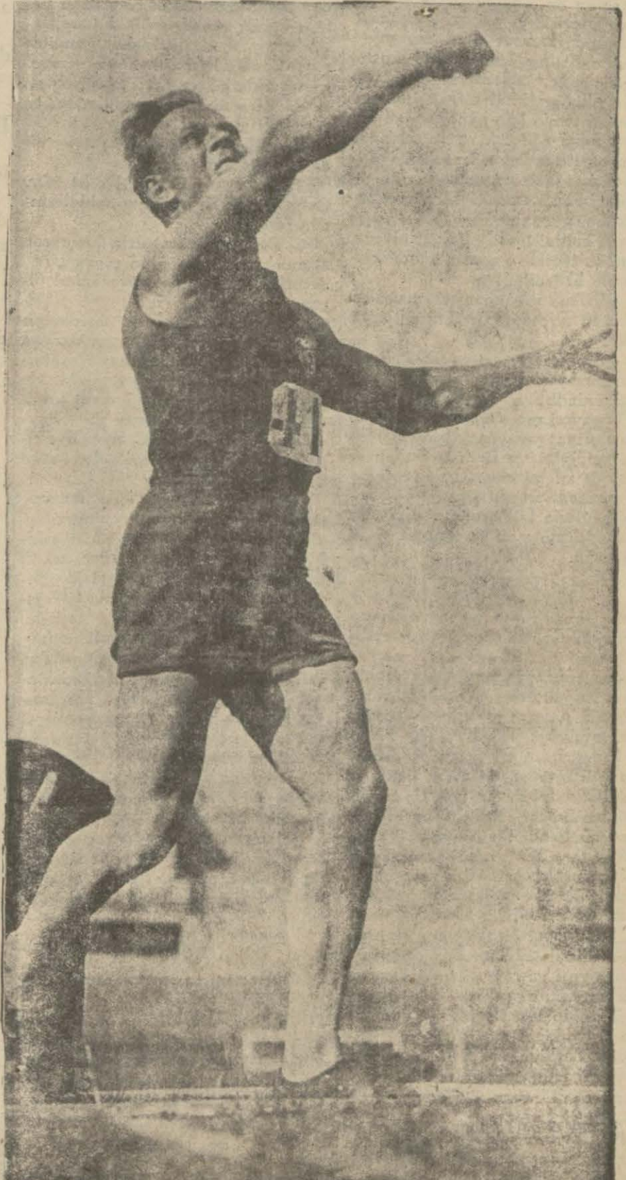
Gelecek haftalarda yazacağımız Gülle atma rekortmenlerinden biri antreneman esnasında.

800, 1500, 3000, 5000 metreleri kimlerin kazanması muhtemel?