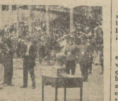
Galatasaray - Fenerbahçe takımları Gazi kurası maçından evvel milli marşı dinlerlerken

Demek oluyor ki Ladumégue'nin başka yıldız mevcut değildir. Defaatla yaptığı yarışlarda bize bu iddiayı ispat etmiş oldu.