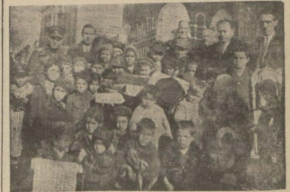
Eyüpte fakir çocuklara elbise ve kumaş tevzi edilirken

Bayram münasebetile yüzlerce çocuğu giyindirip kuşandırıyorlar