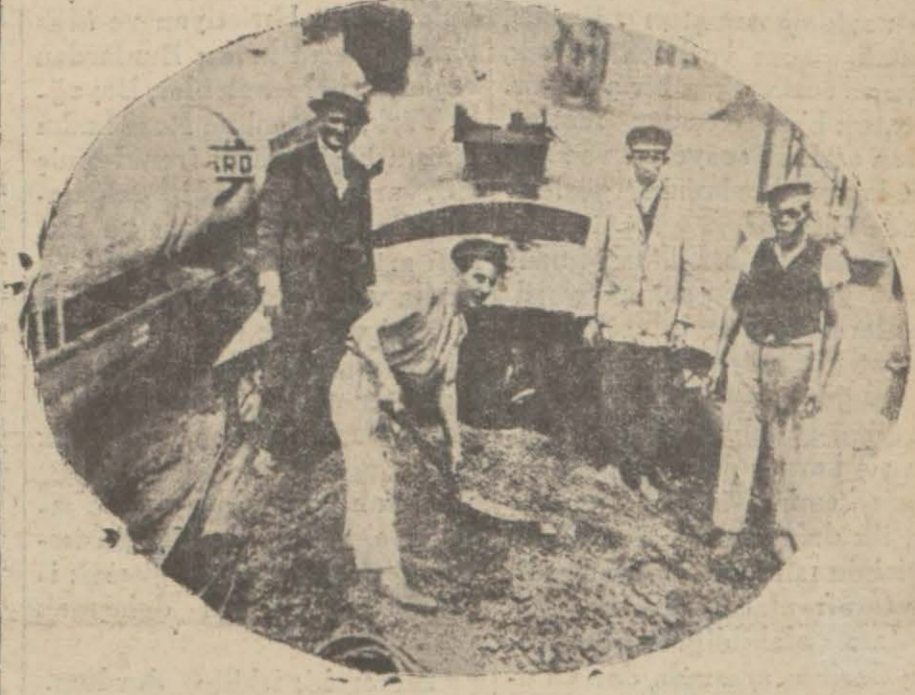
Brezilyada kahve okası boldur ki kömür yerine lokomotiflerde yakılıyor. Halbuki bize okasını 160 kuruşa satıyorlar!