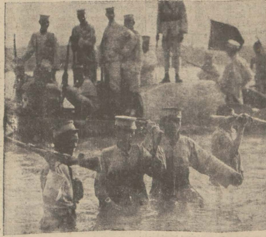
Çin sularında askeri nakliyat.

Son vaziyet hakkında İktisat vekilinin gazetemize beyanatını son haberlerimizde okuyunuz.