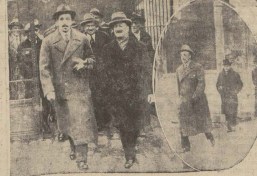
Sabık Kral vapurdan, rıhtımdan ve Ayasofyadan çıkıyor.