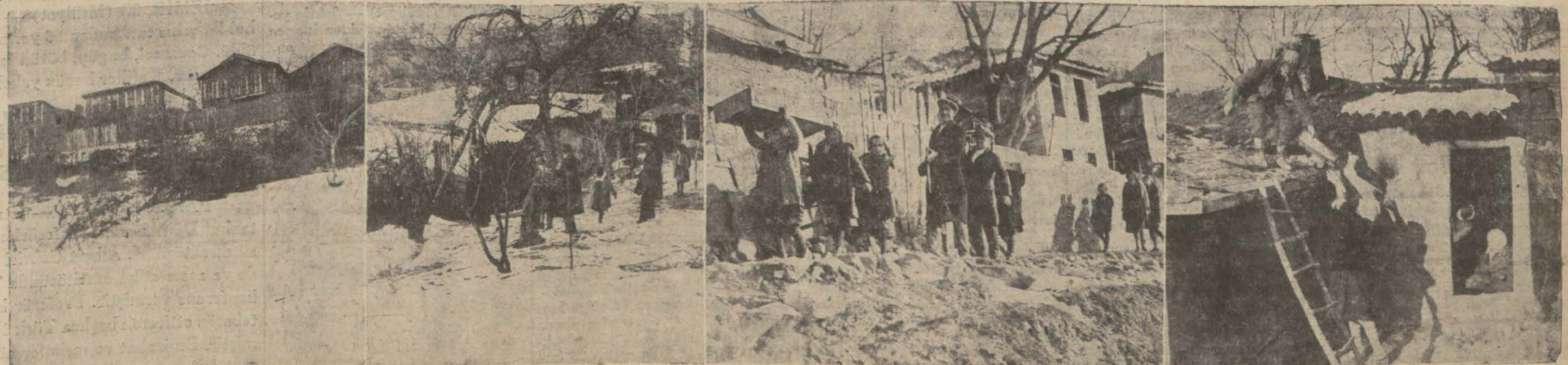
Tepeköyündeki çöküntü ve neyelândan intibalar: Yıkılma tehlikesinde kalan evler, çöken evlerin arkadan görünüşü, ev sahipleri eşya taşıyorlar, fakir bir aile cökmekte olan evinin kiremitlerini topluyor.... (Yazısı iç sahifemizde).

TAHRAN, şubat 932 (Milliyet) — Tahranda bir seyyah için merak edilecek pek çok şeyler bulunabilir. Ben bunlar arasında en şayanı dikkat olarak İranın mülki idare vaziyeti ile nüfus kesafetini, halkın yaşayışını ziraat ve sanayi itibarile bulunduğu mevkii, başlıca tetkik mevzu olarak seçtim. (Devamı 2 inci sahifede)