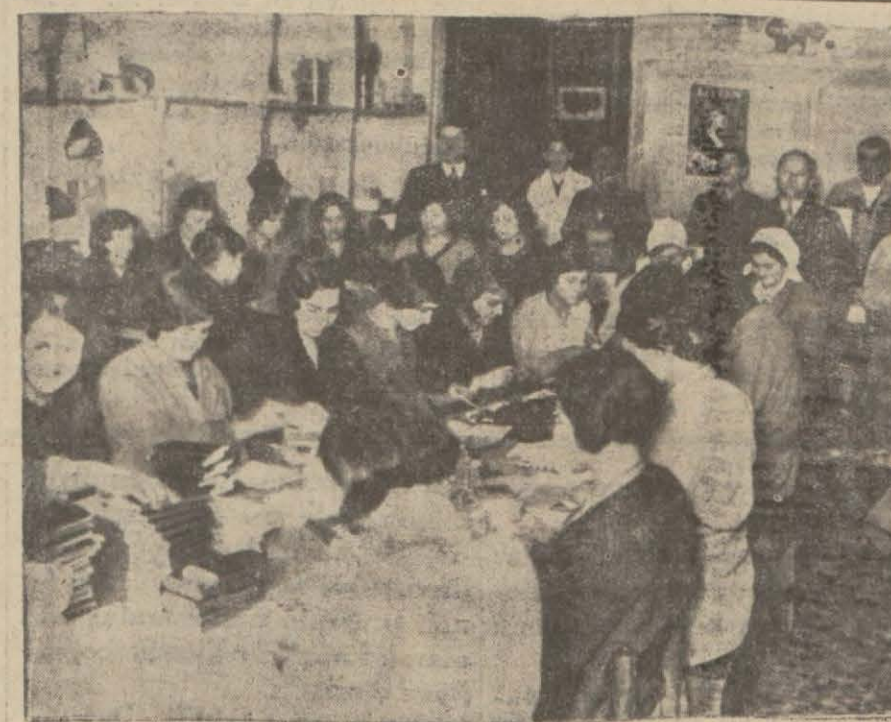
Bir çikolata imalâthesinde çalışan Türk kızları