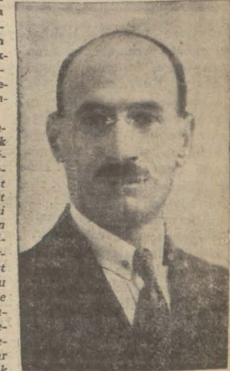
İktisat Vekili Mustafa Şeref Bey

devlet inhisarına alınmasını pek muvafık bulmayanlar bile, hususî vapurların bazar yolcu aldığı işkelye bile uğramamakta olmaları, seyrisefainin fenalığı, seferlerine vaktinde hareket etmemeleri gibi hakikatleri teslim etmektedirler. Bu zevat meyanında bulunan Sanayi Birliği un-