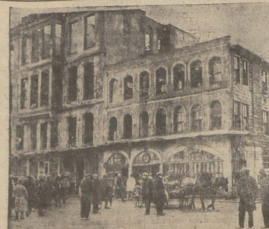
Aksarayda feci bir yangın oldu, ve bir çocuk ta alevler arasında can verdi. Bu faciyanın tafsilâtı iç sahifemizededir.

listeleri tanzimi usulünün terkedileceği hakkında işae edilen haberlerin doğru olmadığını söylemiştir.