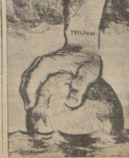
Bir Avrupa karikatürü