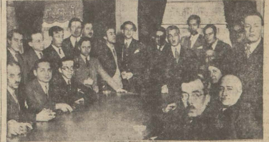
Dün fırka merkezinde toplanan san'atkarlar..